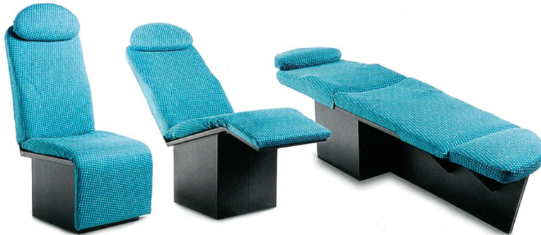
Prototyp mit vollständig pneumatischen Kissen

piche sind ein treffendes Beispiel für Lantals Gesamtlösungen, welche nicht nur hochwertige Textilien, sondern auch deren Zuschnitt nach Mass, Installationslösungen, Produktentwicklungen und eine lückenlose Kundenbetreuung während der gesamten Einsatzdauer umfassen. So sparen konfektionierte Produkte Zeit und senken sowohl Installationskosten als auch administrativen Aufwand.