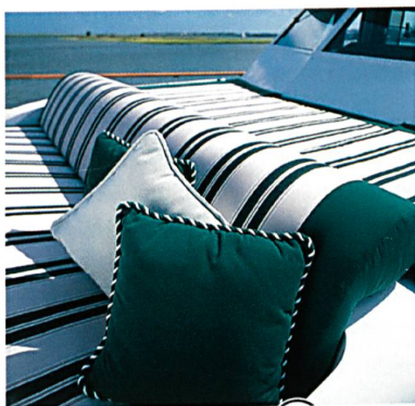
Persennige und Polster, die mit GORE™ TENARA® Nähfäden genäht werden, behalten ihr Aussehen und ihren Wert

GORE™ TENARA® Nähfäden sind in einer grossen Palette von Farben wie auch semitransparent erhältlich. Hergestellt mit farbechten Pigmenten, die eine sehr hohe Lichtbeständigkeit haben, behalten die gefärbten Nähfäden dauerhaft ihre kräftigen Farben. Der semitransparente Nähfaden ist besonders beliebt, weil er sich praktisch mit allen Farben und Mustern von Geweben verwenden lässt, was für die Hersteller eine geringere Lagerhaltung von Nähfäden bedeutet.