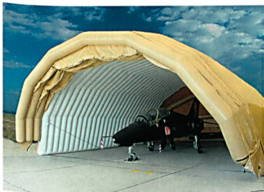
Aufblasbare Flugzeughalle von Lindstrand Technologies, UK

fäden behielten 100% ihrer Festigkeit während des gesamten Tests. Im Gegensatz dazu verlor Baumwolle-/Polyester-Zwirne bereits nach einem Jahr 80% ihrer Reissfestigkeit und Polyester-Nähgarne hatten 67% ihrer Reissfestigkeit nach drei Jahren eingebüsst.