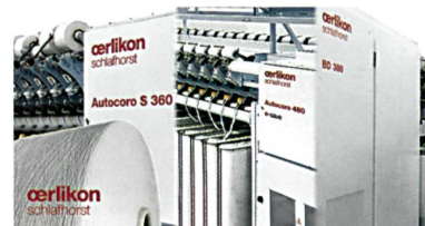
Abb. 3 Die Rotorspinnmaschinenfamilie von Oerlikon Schlafhorst

Oerlikon Schlafhorst stellt auf der ITMA Asia auch die Mitglieder der Rotorspinnmaschinenfamilie vor (Abb. 3), die mit neuen Leistungs-