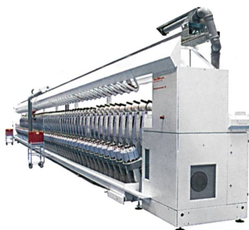
Abb. 1: Autoconer 5

Der Autoconer 5 (Abb. 1) ist ein wichtiger Mosaikstein im «Circle of Success» und ein eindeutiger Beleg für die Innovationsführerschaft von Oerlikon Schlafhorst auf dem Gebiet der Spul-