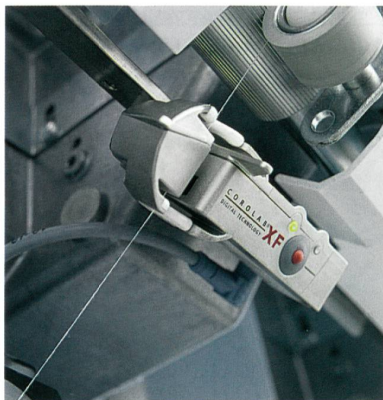
Abb. 4: Corolab XF

Weltweit vertrauen 95% aller Autocoro Spinnereien dem Corolab (Abb. 4). Im Autocoro 480