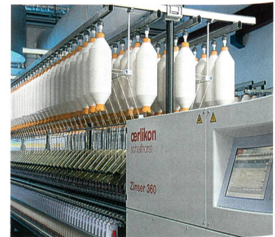
Abb. 6: Die Zinser 360 Ringspinnmaschine

Die Zinser 360, die in Shanghai mit dem automatischen Doffer CoWeMat gezeigt wird, ist eine innovative und hochproduktive Technologieplattform für feine und mittelfeine Ringgarne (Abb. 6). Die dauerhaft verlässliche Maschinen-