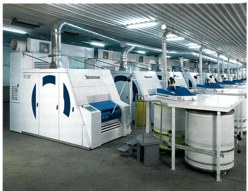
Abb. 1: Die neue Trützschler Hochleistungskarde TC 07

Im Zentrum des Standes zeigt Trützschler zum ersten Mal in Asien die neue Kämmmaschine TC0 1. Diese Maschine positioniert sich mit ihren 500 Kammspielen pro Minute am oberen Ende des Leistungsspektrums. Trützschler Card Clothing TCC zeigt Kardengarnituren aus neuen Speziallegierungen, die bisher unerreichte Standzeiten erreichen.