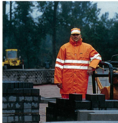
Abb. 3: Bei Regenschutzkleidung im Rahmen der Persönlichen Schutzausrüstung (PSA) ist die Überprüfung der Wasserdichtheit in der Norm EN 343 festgeschrieben