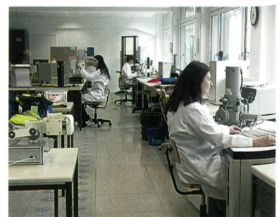
Renoviertes Labor Textilprüfung

baut. Damit verschaffte sich das Unternehmen, das sich seit Jahren über die stetig steigende Nachfrage nach seinen Dienstleistungen freuen darf, den dringend benötigten Platz für Kapazitätserweiterungen.