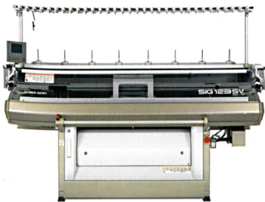
Abb. 1: Die konventionelle Flachstrickmaschine SIG 123 SV

Auf der ITMA Asia 2008 präsentierte Shima Seiki konventionelle Stricktechnik und das WHOLEGARMENT-Stricken. Die Maschine SIG 123 SV (Abb. 1) ist eine computergesteuerte