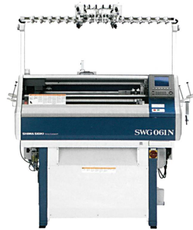
Abb. 3: Die Flachstrickmaschine SWG 061 N

Die Eliminierung von Näh- und Verbindungsprozessen erlaubt eine «Quick-Response-Produktion», ermöglicht den Einsatz von weniger qualifiziertem Personal und spart natürlich Lohnkosten. Damit kann das WHOLEGARMENT-