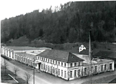
Die Weberei um 1940

Qualität anzubieten. Mut und Innovationsgeist bewies Schlossberg Switzerland mit Bettwäsche, die bunt bedruckt war. Diese drei Neuerungen machten die Marke aus Turbenthal rasch zur Nummer 1 auf dem Schweizer Markt. Die Marke Bonjour Switzerland war zuerst für das hochwertige Frottierprogramm bekannt, später folgte auch Bettwäsche mit Dessins, die berühmte Künstler wie Jean Tinguely, Harald Naegeli oder Peter Greenaway eigens für Bonjour Switzerland entwarfen.