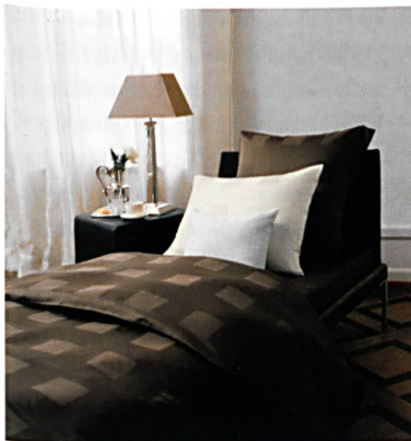
Dessin NOX Chocolat – Schlossberg Switzerland

Hochwertige Drucke und erstklassige Gewebequalität sind besondere Vorzüge, welche die anspruchsvolle Kundschaft der Schweizer Textilmarke schätzt. Der Sinn für das Schöne, die Wahl von natürlicher Baumwolle, erstklassiger Qualität von Garnen und Stoffen, einmalige Farbenvielfalt und Dessins, die von der Natur inspiriert sind, sind noch heute die