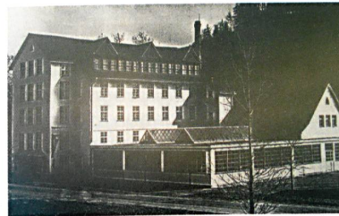
Der 1833 erbaute Spinnererei-Hochbau im Hintergrund

Merkmale von Schlossberg Switzerland. Bonjour Switzerland hingegen spricht mit seinen Produkten die junge, trendorientierte Kundschaft an.