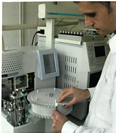
Abb. 2: Qualitativer und quantitativer Nachweis von Geruchssubstanzen auf Werkstoffen und Textilien mittels Gaschromatograph mit Massenspektrometer

In einer zweiten Untersuchung belasten Probanden in einem kontrollierten Trageversuch Textilien mit echtem Körperschweiss. Speziell geschulte Testpersonen bewerten anschliessend qualitativ und quantitativ die Geruchsreduzierung der antimikrobiellen Materialien im Vergleich zu herkömmlichen Textilien.