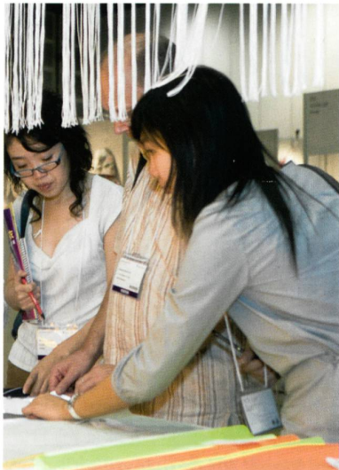
Abb. 3: Wardrobe

Besonderes Ausstellungsforum für neu freigegebene antibakterielle Textilwaren wie eine Nanophotokatalysatorfaser (Abb. 3), 100% natürliche antibakterielle Textilien und andere neue funktionale Textilwaren, die von den führenden Herstellern der Branche vorgelegt werden.