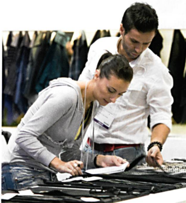
Abb. 1: Trend Forum

Für Besucher der Interstoff Asia Essential im Herbst 2008 wird sich die Teilnahme als äusserst fruchtbar erweisen: Sie können Anbieter vielerlei Mode-, Öko- und funktioneller Textilwaren treffen, branchenspezifische Kenntnisse von weltweit führenden Prüfgorganen für Öko-Textilien und Ökologie-Experten erwerben und ihr Produktwissen über neu freigegebene funktionale Textilwaren und verbesserte Symbole zur Funktionsidentifikation vertiefen (Abb. 1).