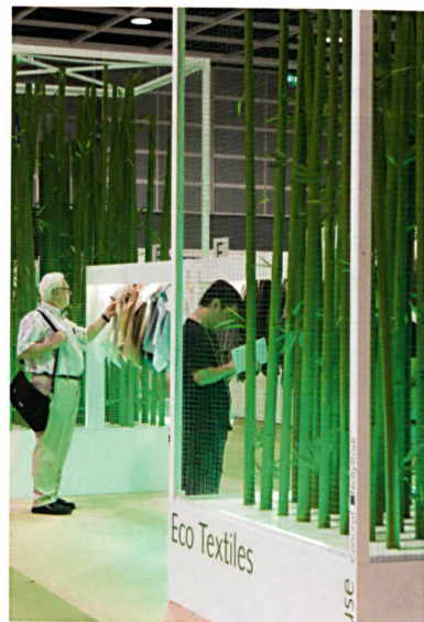
Abb. 2: Ecotextiles

Öko-Textilien sind ein langfristiger und weltweiter Trend. Als Wegbereiter für diesen Markt hat die Interstoff Asia Essential führende Prüfgorgane für Öko-Textilien und Ökologie-Experten eingeladen, um die neuesten Kenntnisse und Lösungen für brandheisse Fragen in der Branche zu bieten (Abb. 2).