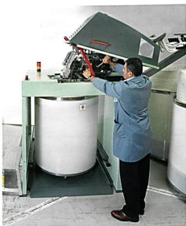
Abb. 3: Gute Zugänglichkeit erleichtert Bedien- und Wartungsarbeiten

Bei der SB-D 11 kommen die gleichen Oberwalzen und Drehteller zum Einsatz wie an der (R) SB-D 40. Dies erhöht die Flexibilität und senkt die Kosten für die Lagerhaltung. Aufgrund der Kompaktheit besteht die SB-D 11 durch eine gute Zugänglichkeit. Dadurch lassen sich Bedien-, Einstell- und Wartungsarbeiten einfach und rasch durchführen (Abb. 3). Zudem erlaubt