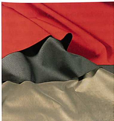
Abb. 3: schoeller®-styltec-Spezialgewebe

speziellen Finishes und Beschichtungen begeistern sie durch ihre technische Anmutung, einen aktivitätsangepassten Schutz sowie hohen Tragekomfort. Die schoeller®-styltec-Spezialgewebe (Abb. 3) kombinieren sportive Mode und in-