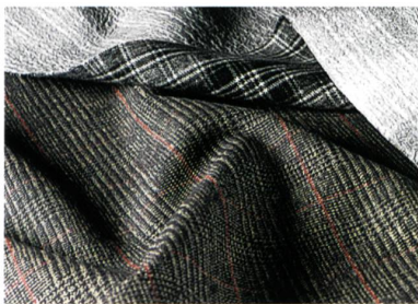
Abb. 1: Karo

Organische Fasern wie Wolle oder Baumwolle repräsentieren natürliche Beständigkeit. Originale Schotten-Karos, Glencheck-Muster, Fischgrat oder Pepita-Designs entsprechen dem Wunsch nach echten, beständigen Werten. Doch wird der Authentic-Look im Herbst/Winter 2009/10 ungewohnt anders interpretiert. So blitzen die zum Teil kräftigen Farbkompositionen nun auch auf der Innenseite der edlen schoeller®-shape-Gewebe hervor. Die bondierten Double-Face mit glatten Baumwoll-Mischgeweben in Schwarz, Beige- oder Brauntönen auf der Aussenseite werden als Sportjacken oder Trenchcoats mit Sicherheit nicht nur auf dem Land Blicke auf sich ziehen. Funktion wird mit PU-Coatings addiert – und z. B. auch mal sehr effektiv in milchigem Weiss auf der Vorderseite, damit das schwarz-weiße Karo nur noch sanft verwischt durchschimmert (Abb. 1).