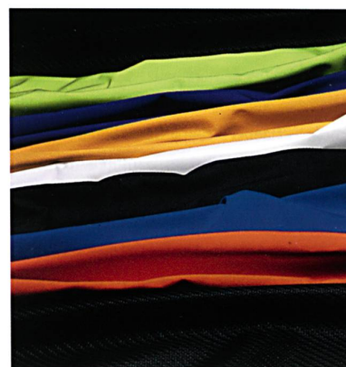
Abb. 6: Schoeller-Textilien mit coldblack®

Die von Schoeller lancierte coldblack®-Ausrüstungstechnologie wurde weiterentwickelt und schützt nun noch zuverlässiger vor Sonne. Durch den bekannten Effekt beeinflusst sie aktiv die Absorption von Sonnenstrahlen und hält angenehm kühl. Ausserdem baut sie nun zusätzlich auch einen zuverlässigen Schutz vor schädlicher UV-Strahlung auf. Und sie ist auf Wunsch auf beinahe allen Schoeller-Geweben und -Farben erhältlich (Abb. 6). Helle Textilien