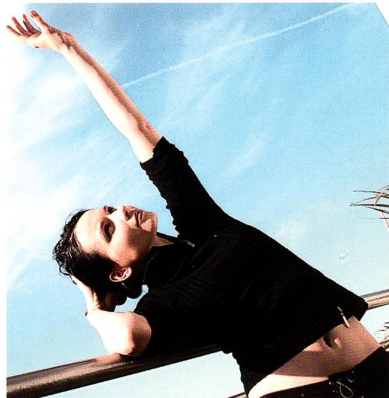
Wohlfühlen mit coldblack®

diesen Schutz sorgt der neue Effekt von coldblack®, denn mit der weiterentwickelten Ausrüstung wird auch ein UV-Schutz von mindestens 30 garantiert. Erfahrungen haben gezeigt, dass auf Schoeller-Textilien mit coldblack® sogar oft ein UPF von 50+ erreicht wird. Die coldblack®-Ausrüstung ist somit eine Sonnenschutz-Technologie, die negative Aspekte der Sonne unabhängig von der Farbe oder Textilart