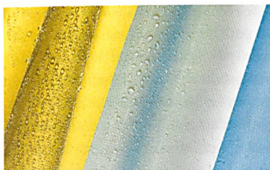
Abb. 4: schoeller®-spirit-Gewebe mit c_change™-Klimamembrane

eine faszinierende Optik – andererseits sorgt sie natürlich für den optimalen Witterungsschutz. Denn c_change™ kann sich unterschiedlichen Begebenheiten durch Öffnen und Schliessen anpassen und schafft dadurch stets das ideale Körperklima. Mal matt glänzend, dann wieder durch Alubedampfung perlmuttfarben irisierend, überraschen sie allesamt durch ihre verhaltene, sportliche Transparenz. Die funktionellen Leichtgewichte in klaren, selbstbewussten Farben präsentieren sich sowohl allein als auch als Überziehjacke sehr zweckmässig und praktisch und sind durch ihr extrem geringes Packvolumen ideal für unterwegs.