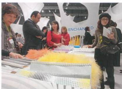
Besucher des Trend-Forums

beitsunterlage konzipierten Trend-Buch gelobt wurden. Das Trendforum zog in diesem Jahr mehr Besucher an als in den Jahren zuvor. Ein grosser Erfolg für die Mitglieder des Trendtable, der in diesem Jahr unter der Ägide des Stijlinstituut Amsterdam stand.