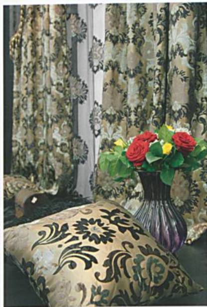
Gemeinschaftspräsentationen Asien

Besonders zufrieden stimmte die Aussteller die gute Frequenz und Entscheiderqualität der Besucher. Ausser den traditionell stark vertretenen Besuchergruppen des Handels, des Handwerks, der Raumausstattung, dem Interieur Design und der Industrie kamen in diesem Jahr mehr Fachleute aus Architektur, Hotellerie und Klinikausstattung zur Heimtextil. Das reichhaltige Produkt- und Themenangebot der Heimtextil 2009 stimmte auch die Besucher hoch zufrieden: 91% der Befragten sowohl aus dem In- und Ausland gaben diese Bewertung ab.