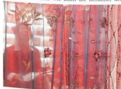
Qualitätsanbieter Asien

Entgegen der schlechten Ausgangslage kamen die Aussteller wie auch die Besucher der