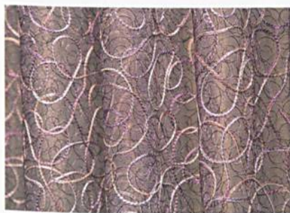
Gardinen, Quelle – Messe Frankfurt Exhibition GmbH / Jean-Luc Valentin

Inland kamen deutlich mehr Besucher als angesichts der allgemeinen Wirtschaftslage zu erwarten waren. Deutschland bleibt, wie auch auf Ausstellerseite mit 440 Firmen, mit rund 27'000 Besuchen die stärkste Nation. Der Internationalitätsgrad sank um einen %punkt auf 63. Die Reduktion der ausländischen Besuchszahlen erklärt sich aus der schlechteren Branchenerwartung und der Wirtschaftslage: Die von fern angereisten Besucher kamen in weit kleineren Delegationen und für einen im Schnitt von 2,4 auf 2,0 Tage verkürzten Aufenthalt. Die seit der Finanzmarktkrise besonders betroffenen Nationen, wie etwa die USA und China, sowie weitere, an den US-Dollar-Kurs angebundene Volkswirtschaften wie Indien oder Südkorea, zeigten hier signifikante Rückgänge. Aus den europäischen Staaten, wie etwa Italien, Portugal, Spanien oder Schweden, die 2008 auch im Europa-Vergleich die deutlichsten Rückgänge ihrer Exporte zu verzeichnen hatten, kamen ebenfalls weniger Besucher.