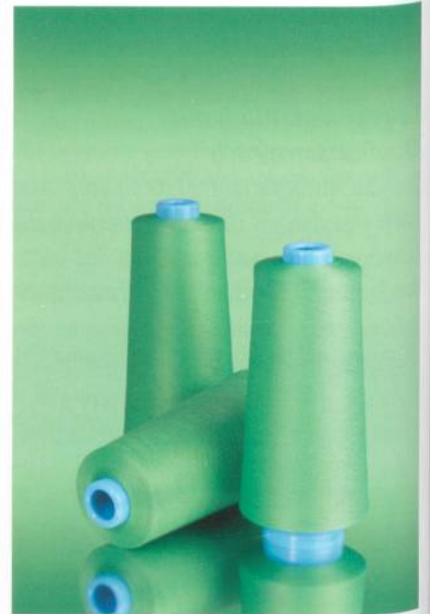
Abb. 2: P_Sabatex

lierten Produktlinien SabaC, Serafil und Rasant – für viele Anwendungen die Originale mit einem hohen Mass an Authentizität (Abb. 2). Für