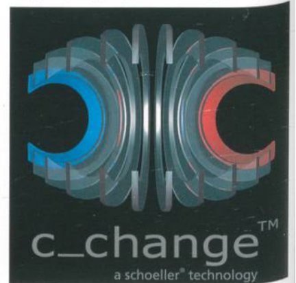
Abb. 2: Die bionische Klimamembrane c_change™

NanoSphere®, schoeller®-PCM™, cold-black® oder der bionischen Klimamembrane c_change™ (Abb. 2) veredelt, garantieren sie allesamt höchste Funktionalität, Strapazierfähigkeit, Langlebigkeit und Pflegeleichtigkeit.