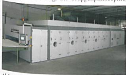
Abb. 4: Fleissner-Bandofen

Um auch komplette Nonwovenanlagen für die unterschiedlichsten Thermoverfestigungsanwendungen anbieten zu können, hat Fleissner einen neuen Bandofen entwickelt (Abb. 4). Dieser folgt der Gruppenphilosophie,