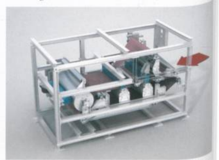
Abb. 3: MiniJet-Anlage zur Wasserstrahlverfestigung

eine hochwirtschaftliche Lösung für die Herstellung von Wattedpads und anderen Baumwollprodukten. Das System ist auf die Bedürfnisse von Instituten und Firmen zugeschnitten, die Forschungs- und Entwicklungsarbeit machen, auf Produzenten in Nischenmärkten und auf «Anfänger» im Nonwovensektor (Abb. 3).