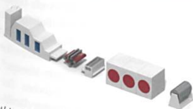
Abb. 5: Anlage für die chemische Verfestigung

Fleissner liefert seit vielen Jahrzehnten Komponenten für chemische Standardverfestigungsprozesse (ca. 80 m/min) wie etwa Schaumfoulard und Trockner. Daneben hat Fleissner vor kurzem das chemische Hochgeschwindigkeitsverfestigungsverfahren entwickelt (Abb. 5). Mit einer kleinen Wasserstrahl-