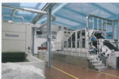
Abb. 1: Das neue Erko-Kardensystem im Fleissner-Technikum

Das erste Projekt innerhalb der Gruppe war die Entwicklung einer neuen Karte für die Anforderungen wasserstrahlverfestigter Produkte. Das Ziel war eine hohe Leistung von bis zu 400 kg/h/m mit einem guten Festigkeitsverhältnis in Längs- und Querrichtung (MD/CD) von 3:1 oder besser und einem Gewichtsbereich von 20–100 g/m 2 , der sich gegen eine Dreifachabnehmerkrepel behaupten kann. Alle Ziele werden mit der neuen Wirrvlieskarte EWK413 erreicht.