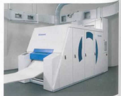
Abb. 2: TC- 07H mit Staubeinheit TC-SU

Gleichzeitig haben Fleissner und Trützschler auch an einer Lösung für Kleinanlagen gearbeitet. Als Folge davon ist das neueste Mitglied der Fleissner-Wasserstrahlverfestigungsfamilie jetzt in zwei Standardgrössen erhältlich. In Kombination mit der neuen Trützschler-Karde TC-07-H (Abb. 2) mit Vliesabnehmer bietet es