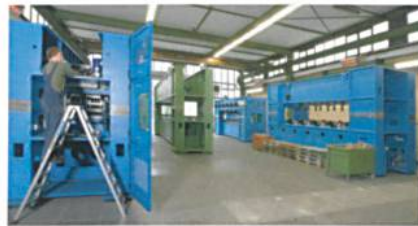
Abb. 6: Vernadelungsmaschinen

Das folgende Foto zeigt die Produktion auf einer 6,8 m breiten Nadelmaschine und drei Nadelmaschinen mit einer Breite von 3,8 m. Es sind sowohl Einfach- als auch Doppelnadelmaschinen dargestellt (Abb. 6).