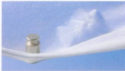
Abb. 2: Hyperlacing-Produkt

Nadelvliese aus feinen Fasern mit einem Flächengewicht von ca. 30 g/m 2 . Diese Produkte finden Verwendung in den Bereichen Medizin, Hygiene, Vlieskunstleder, Interlinings und als Filtermedien (Abb. 2).