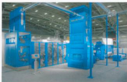
Abb. 3: Die kostengünstige Nadelvliesanlage AlphaLine

Ausserdem informierte Dilo über die AlphaLine. Diese kostengünstige Nadelvliesanlage wurde für mittlere Durchlaufgeschwindigkeiten bis ca. 80 m/min entwickelt. AlphaLine ist eine kompakte und ökonomische Lösung für universelle Vliesbildungs- und -verfestigungsaufgaben. Sie besteht aus den Komponenten AlphaFeed, AlphaCard, Dilo-Layer DLA und den Alpha-Nadelmaschinen.