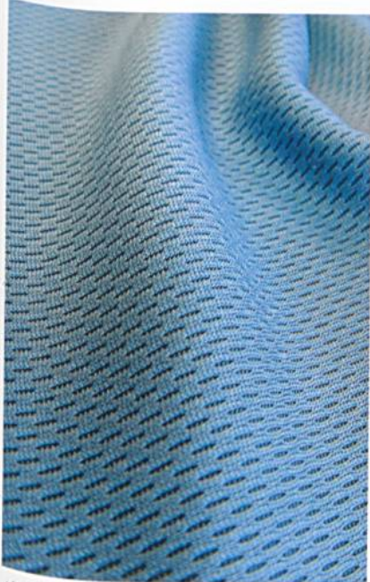
Abb. 1: e1 PCR Bioactive

SWAN coldblack® nennt ESCHLER sein bi-elastisches Funktionsmaterial mit «Golfball»-