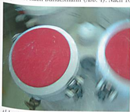
Abb. 4: Regentest nach Bundesmann

NanoSphere® weist – wie neue Tests belegen – eine ausserordentliche Belastbarkeit auf. Neben vielen anderen strengen Untersuchungen wurde NanoSphere® nach den Kriterien der AATCC-Testmethode 79 geprüft. Selbst nach 30'000 Zyklen war die Funktionalität in Bezug auf die Abriebfestigkeit sowie die Wasser- und Ölabweisung noch immer auf einem sehr hohen Niveau, während sie bei einer vergleichbaren herkömmlichen Textilausrüstung bereits nach 5'000 Zyklen fast bei null lag. Ein anderes Merkmal für die Langlebigkeit zeigte sich beim Regentest nach Bundesmann (Abb. 4). Nach 10