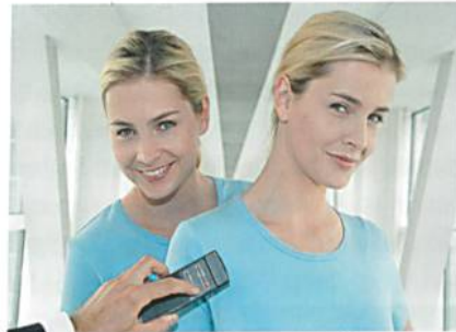
Abb. 5: Die Textil-DNA von Schoeller weiss es in Sekundenschnelle – Demonstration auf der Techtextil 2009 in Frankfurt

Auf der internationalen Messe für technische Textilien TECHTEXTIL in Frankfurt stellte das Schweizer Textiltechnologieunternehmen Schoeller eindrucksvoll mit Zwillingen eine spezielle «Textil-DNA» vor (Abb. 5). «Wir