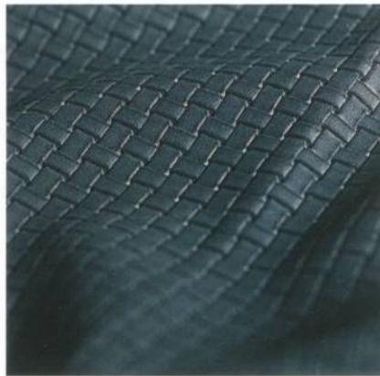
Abb. 7: Structured Black

Die Sehnsucht nach Echtheit, wertvollen Klassikern und dem Gefühl von Sicherheit wird