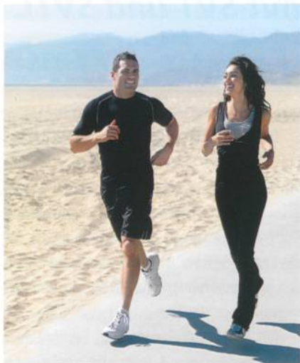
Abb. 1: Nachgewiesen – wer ein coldblack®-Shirt trägt, schwitzt nur etwa halb so viel

Wer nur halb so viel schwitzt, fühlt sich besser und ist länger fit. Das leuchtet jedermann ein. Und genau das bietet die coldblack®-Technologie von Schoeller, wie ein Test der EMPA in St. Gallen (www.empa.ch) aufzeigt. In deren Labor wurde der Tragekomfort von coldblack® unter erhöhtem Wärmeeinfluss untersucht. Drei Shirts (beige, coldblack® in Schwarz, Standard in Schwarz) wurden dazu an einen Schwitztorso mit simulierter Schwitzfunktion montiert. Die Resultate sprechen für sich: Wer ein coldblack®-Shirt trägt, schwitzt – im Vergleich zum gleichen, unbehandelten schwarzen Shirt – nur etwa halb so viel, um die Erhöhung der Temperatur der Haut auszugleichen (Abb. 1). Und wer weniger schwitzt, ist besser drauf,