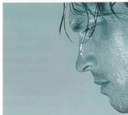
Abb. 2: Tatsache – wenn körperlich hart trainiert wird, beizt sich der Körper auf

3XDRY® optimiert das Kühlsystem des Körpers. Wenn körperlich hart trainiert wird, erzeugen die Muskeln Wärme und heizen den Körper auf (Abb. 2). Der Mensch beginnt zu schwitzen.