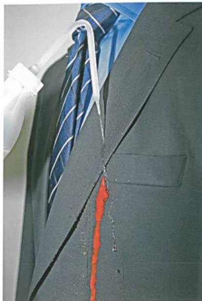
Abb. 2: NanoSphere® schützt jetzt auch hochwertige Wolle vor Verschmutzung

Wer kennt es nicht – eine kleine Unachtsamkeit und schon ist es passiert: Die Seidenkrawatte ist voller Saltsaucenspritzer und muss chemisch gereinigt werden. Im Flugzeug kippt der Kaffeebecher über den edlen Wollanzug und es bleibt keine Zeit zum Umziehen vor dem wichtigen Geschäftstermin. Solch peinliche Momente gibt es dank NanoSphere® immer weniger häufig, denn den unsichtbaren Schutz mit Nanostruktur gibt es jetzt auch für Wolle und Seide. Durch den cleveren Selbstreinigungseffekt perlen die meisten Substanzen ganz einfach vom schicken Anzug, dem Hemd, der Krawatte oder der lässigen Leisurewear-Jacke ab. Selbst Ketchup oder Honig (Abb. 2) lassen sich ganz einfach