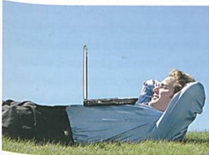
Abb. 1: Feelgood: Hemden mit 3XDRY® halten den Körper trockener, minimieren Schweißflecken und erzeugen einen angenehmen Kühleffekt in allen Situationen

Die 3XDRY®-Funktionsausrüstung kombiniert zwei Technologien auf einem Textil: Von aussen wird das Textil bis zur Mitte wasserabweisend und von innen bis zur Mitte wasseraufnehmend ausgerüstet. Durch diese Kombination vermindert die Feelgood Technology 3XDRY® sichtbare Schweißflecken, erzeugt einen angenehmen Kühleffekt und verbessert die Schmutz- und Wasserabweisung (Abb. 1). Bekleidung mit