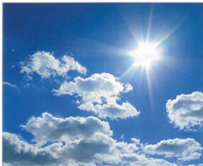
Abb. 4: UV-Protector

Schutzfaktor von mindestens 30 auf (Abb. 4). Dank dieser doppelten «Schutzschild»-Funktion eröffnet sich der innovativen Technologie ein weites Anwendungsfeld, das Mode, Funktionsbekleidung und Textilien für den Outdoorbereich (etwa Sonnenstoren oder Bezüge von Gartenmöbeln) umfasst. Die coldblack®-Ausüstungstechnologie wurde von Schoeller Technologies AG und Clariant International Ltd. entwickelt und im Juli 2008 lanciert.