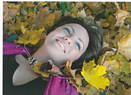
Abb. 3: Sonnenschutz für das ganze Jahr

Die coldblack®-Ausrüstung schafft Abhilfe. Sie vermindert die Absorption der wärmenden Sonnenstrahlen, weshalb sich speziell dunkle Farben wenig aufheizen. Parallel dazu bietet dieser Textilfinish einen zuverlässigen Schutz gegen die schädliche UV-Strahlung (Abb. 3). coldblack® gibt es deshalb neu für viele Wollprodukte und Übergangsteile.