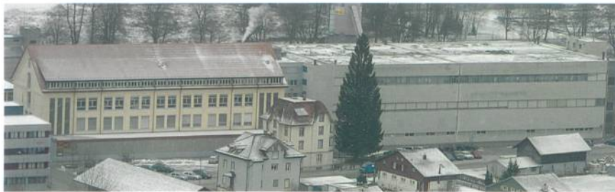
Panoraaufnahme des Produktionsgebäudes der Bäumlin & Ernst AG, Wattwil

Förderbändern werden Garne der BEAG weiterverarbeitet.