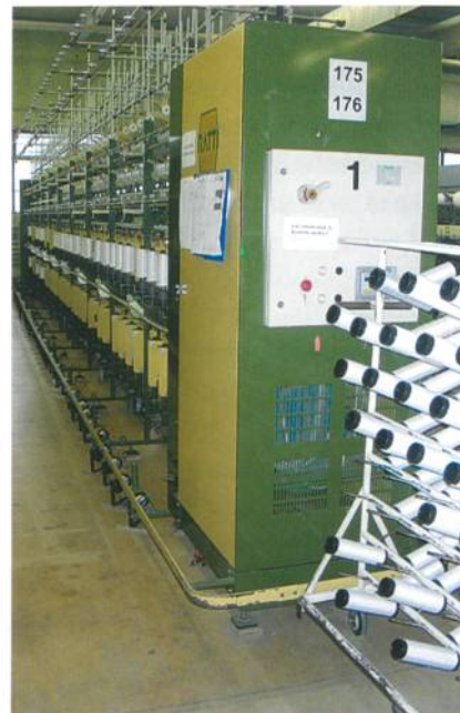
Etagenzwirnmachine für Kupfermischgarne