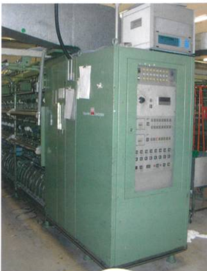
Org. Heberlein Spindeltexturiermaschine FZ-27