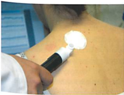
An den Hohenstein Instituten wurde die Freisetzung von Wirkstoffen aus den Nanosol modifizierten Wundauflagen u.a. auch an Probanden (in vivo) untersucht

sonderes Aussehen haben wir auch mit unseren Projekten zur Biotherapie erregt, wie z. B. Wundauflagen, bei denen Bakteriophagen oder der Extrakt der Goldfliege die Heilung chronischer Wunden beschleunigen.