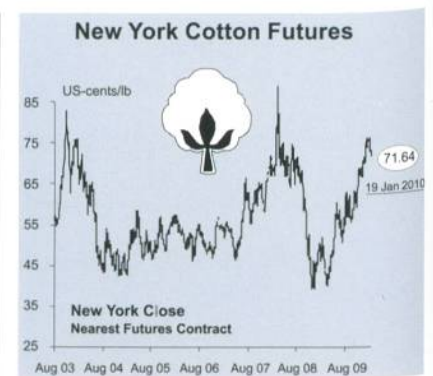
Abb. 1: Baumwollpreisentwicklung

Die Daten über die tatsächlichen Ernteflächen sind für 2009 noch nicht verfügbar. Dennoch zeigen die Schätzungen, dass ein Areal von 9'555 acres (3'867 ha) gegenüber 7'289 acres (2'950 ha) im Jahre 2008 erreicht werden könnte.