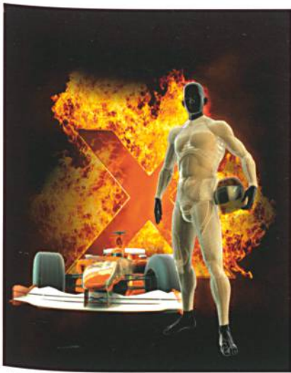
Abb. 5: X-BIONIC® FireShield

die Körpertemperatur zu regulieren, hat der Mensch ein hocheffektives Klimasystem entwickelt: das Schwitzen. X-BIONIC® hat diese wissenschaftlichen Erkenntnisse genutzt und Technologien entwickelt, die kühlen, wenn man schwitzt, und wärmen, wenn man friert. So wird der Körper beim Klimamanagement optimal unterstützt und wertvolle Energie gespart, die direkt der eigentlichen Aktivität zugeführt wird. Die grosse Herausforderung bei der Entwicklung lag darin, die komplexe dreidimensionale Strickkonstruktion von X-BIONIC® im brandsicheren Material Aramid umzusetzen (Abb. 6). Aramid ist eine hochtechnische Kunstfaser, die wegen ihrer Festigkeit vor allem im Bereich der Sicherheitstextilien verwendet wird. Sie hält Temperaturen von über 400 °C aus, bevor sie verkohlt. Würde die Faser schmelzen, könnte dies zu Verletzungen auf der Haut führen.