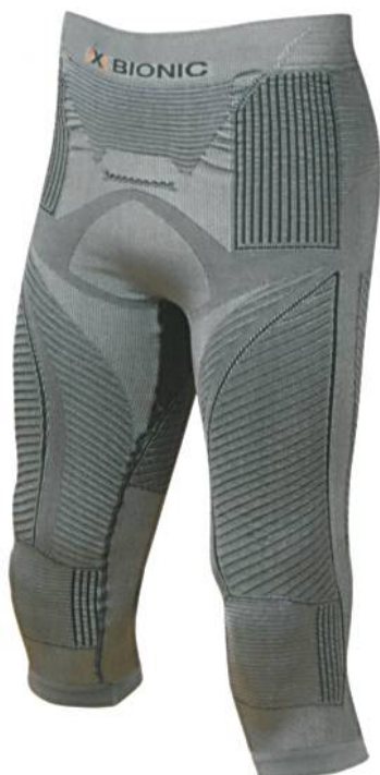
Abb. 2: X-Bionik Radiactor™, Unterbose

Bodo W. Lambertz nun eine neue Dimension: Sie fügen dem komplexen System des Energy Accumulator™ aus Schweißmanagement, Kühlung und Isolierung ein reaktives Wärmehaltvermögen hinzu. Das exklusive Garn xitanit™ ist der Schlüssel dazu. Es reflektiert die Wärmestrahlung des Körpers und hält die Wärme so aktiv zurück. Gleichzeitig unterstützt das Hightech-Material die kühlende Wirkung der Wäsche, indem es wie ein Silberlöffel im Teeglas überschüssige Wärme abführt und Schweiß grossflächig über den Körper verteilt. Das Ergebnis: In der aktiven Phase bleibt ein dünner Schweißfilm auf der Haut, über das 3D-BionicSphere® System verdunstet und den Körper effektiv kühlt. Überschüssiger Schweiß gelangt nach aussen, um dort hautfern und weitgehend temperaturneutral zu verdunsten.