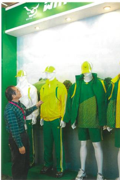
outdoor ispo, Wild Roses (International) AG

neuen Konzepten, wie zum Beispiel für die ispovision, oder das Opinion Leader Konzept, werden wir diese Position in Zukunft weiter ausbauen.»