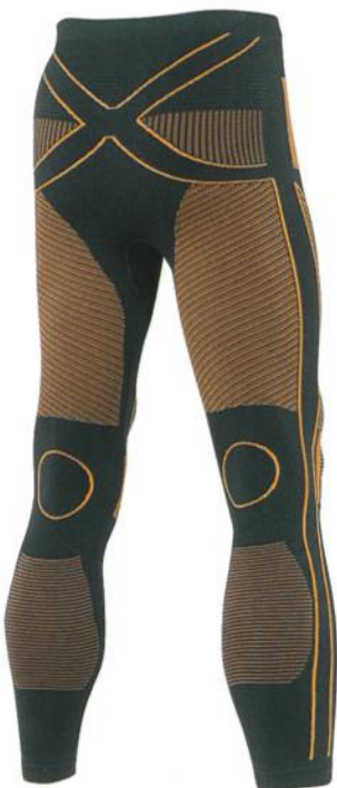
Abb. 4: X-BIONIC® Energy Accumulator® Evo, ExpansionRibs™

ist dabei das grossflächige 3D-BionicSphere® System. Sobald die ersten Schweisstropfen rinnen, sorgt es für die notwendige Kühlung. Zunächst lässt X-BIONIC® nach dem Motto «Schweiss mindern, aber nicht verhindern» eine bestimmte Restfeuchte auf der Haut. So wird sowohl eine Überproduktion an Schweiß unterbunden als auch durch die Verdunstungskälte eine kühlende Wirkung erzielt.