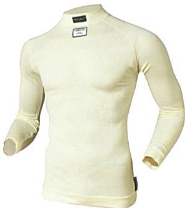
Abb. 6: X-BIONIC® FireShield, Unterbemd

Ein Formel 1-Pilot verliert während des Rennens mehrere Kilogramm Sch weiss, so die Angaben der FiA. Umso mehr Bedeutung kommt der Klimaregulierung zu. Das X-BIONIC® FireShield verfügt über die patentierten Kühltechnologien von X-BIONIC®. Das 3D-BionicSphere® System