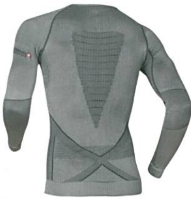
Abb. 1: X-Bionik Radiactor™, langärmelige Unterwäsche

Bodo W. Lambertz nun eine neue Dimension: Sie fügen dem komplexen System des Energy Accumulator™ aus Schweißmanagement, Kühlung und Isolierung ein reaktives Wärmehaltvermögen hinzu. Das exklusive Garn xitanit™ ist der Schlüssel dazu. Es reflektiert die Wärmestrahlung des Körpers und hält die Wärme so aktiv zurück. Gleichzeitig unterstützt das Hightech-Material die kühlende Wirkung der Wäsche, indem es wie ein Silberlöffel im Teeglas überschüssige Wärme abführt und Schweiß grossflächig über den Körper verteilt. Das Ergebnis: In der aktiven Phase bleibt ein dünner Schweißfilm auf der Haut, über das 3D-BionicSphere® System verdunstet und den Körper effektiv kühlt. Überschüssiger Schweiß gelangt nach aussen, um dort hautfern und weitgehend temperaturneutral zu verdunsten.