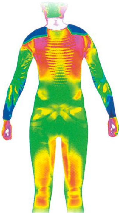
Abb. 3: X-BIONIC® Energy Accumulator® Evo, Thermoaufnahme

ist dabei das grossflächige 3D-BionicSphere® System. Sobald die ersten Schweisstropfen rinnen, sorgt es für die notwendige Kühlung. Zunächst lässt X-BIONIC® nach dem Motto «Schweiss mindern, aber nicht verhindern» eine bestimmte Restfeuchte auf der Haut. So wird sowohl eine Überproduktion an Schweiß unterbunden als auch durch die Verdunstungskälte eine kühlende Wirkung erzielt.