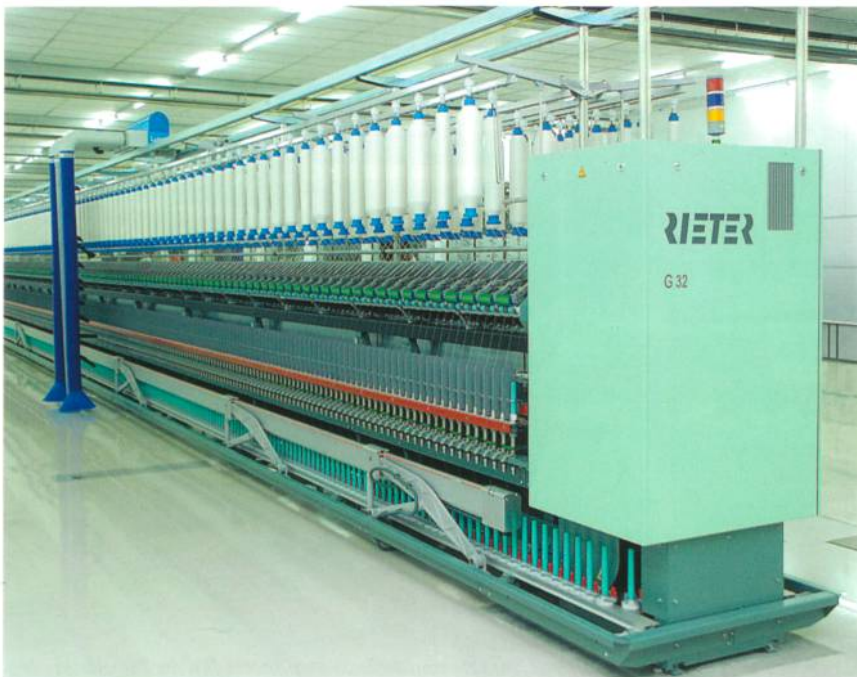
Abb. 1: Ringspinnmaschine G32

72 kg/h Kammzug – das ist die reale Leistung der halbautomatischen Kämmaschine E 66 (Abb. 2). Ihre Entwicklung basierte auf der Basis der jahrelangen Erfahrungen auf dem Gebiet des Kämmens, mit mehr als 7'800 verkauften Maschinen. Zusammen mit dem Computer-Aided-Process-Development – C•A•P•D500 – wurde der Kämmprozess hinsichtlich Bewegungsablauf, Belastung der Arbeitswerkzeuge sowie Luft- und Energieverbrauch optimiert. Die hohe Leistung von 72 kg/h wird unter einem idealen Laufverhalten und höchster Qualität bei 500 Kamm-