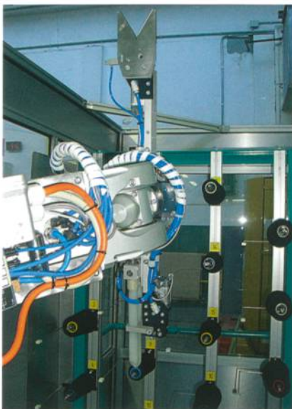
Abb. 2: Pick&Place-Einrichtung mit Schneidwerkzeug (oben)

Zudem hat KARL MAYER seine Musterkettenschärmaschine modifiziert, um eine separate Bewegung des Drehgatters zu ermöglichen.