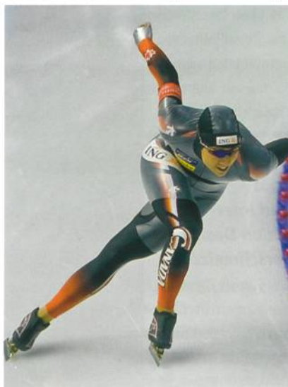
Abb. 1: Ice Speed Skating mit Eschler-Maschenwaren

Alpinrennläufer, Skispringer, Bobfahrer, Rodler, Eisschnellläufer, Langläufer, Nordische Kombinierer und Skeletoni der verschiedensten Nationalmannschaften gingen in Vancouver in Rennanzügen aus Eschler-Stoffen an den Start (Abb. 1). Sie gewannen insgesamt 40 Gold-, 38