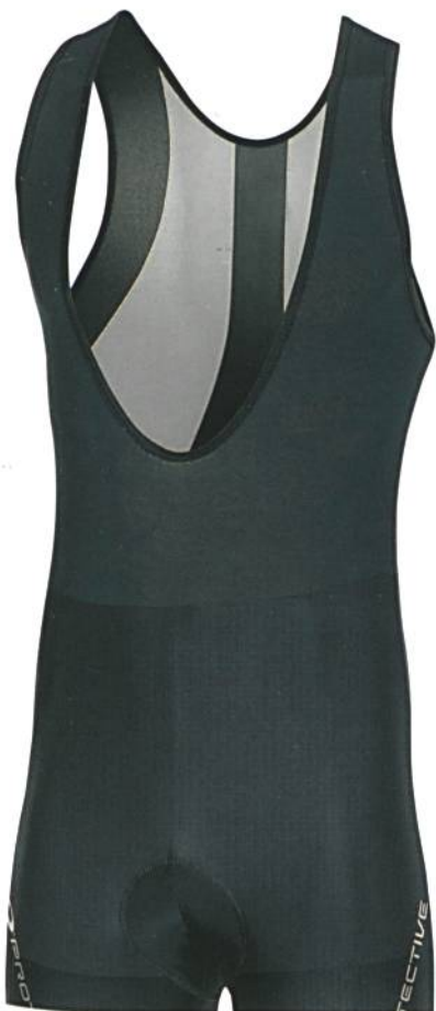
Abb. 3: Kompressionssitz reduziert die Vibrationen der Muskeln

Protective setzt mit der Kona Bib Short im Sommer 2010 neue Massstäbe: «Flash» wurde speziell für schweisstreibende Sportarten entwickelt