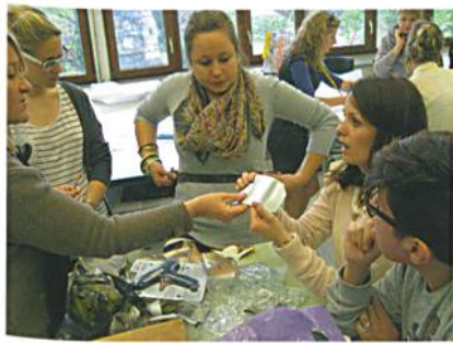
Auswahl der Materialien (gesponsert von Jakob Schlaepfer und Swisstulle AG)