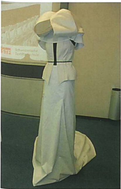
Eins von neun Modellen aus der «Ready-to-live»-Kollektion

Als Fokus des Projektes wurde das Thema «Bewegung» ausgewählt. Dieses Thema kann auf vielfältigste Weise interpretiert werden und ermöglicht eine spannende visuelle Umsetzung in der Fashion Show. Die technologische Basis für das Projekt sind die von der ETH entwickelten miniaturisierten Sensoren BodyANT, mit denen Körperbewegungen gemessen werden können.