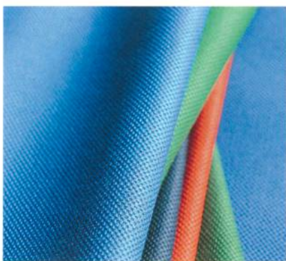
RGB-Weave; Foto: Gessner AG

trächtigen. Eine Anhebung der Lohnnebenkosten kann zurzeit kein Thema sein. Forderungen der Gewerkschaften, die zu einer Verteuerung der Arbeit führen, hätten fatale Auswirkungen nicht nur auf die Textil- und Bekleidungsindustrie, sondern auch auf den Werkplatz Schweiz insgesamt. Eine liberal gestaltete Schweizer Aussenwirtschaftspolitik und eine konsequente Erweiterung des Aussenhandelsnetzes, sind weitere Forderungen des Textilverbands Schweiz. Zudem sind der Ausbau einer funktionsfähigen EURO-MED-Zone und die Lancierung moderner Ursprungsregeln notwendig.