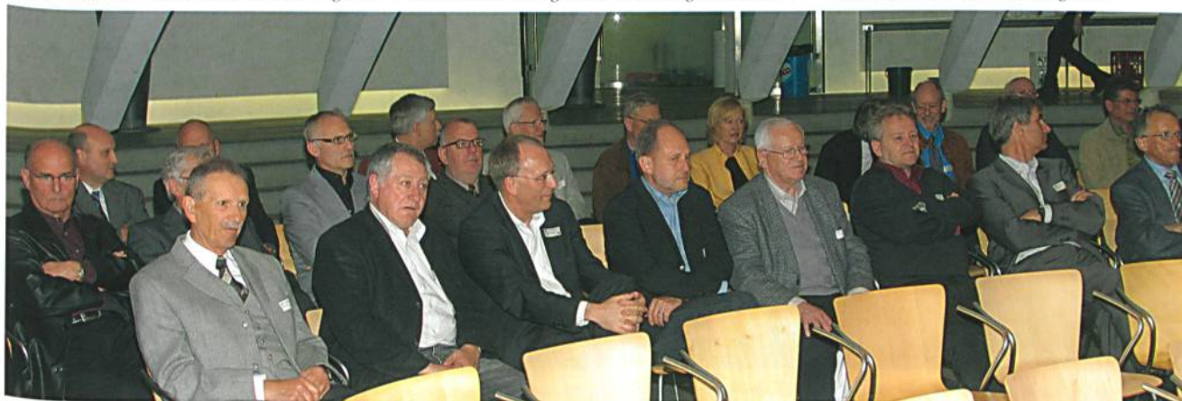
Generalversammlung im Pfälzkeller in St. Gallen