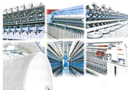
Abb. 4: Ringspinn-, Rotorspinn- und Spultechnologie von Oerlikon Schlafhorst

Dies bewies das grosse Interesse und der enorme Besucherandrang auf dem Oerlikon Schlafhorst