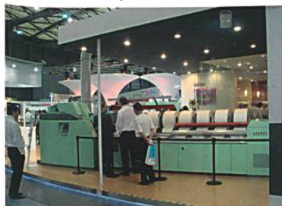
Abb. 3: Kämmmaschine E 66 auf dem Rieter Messestand

Die Anstrengungen für die hohe Kunden- und Marktorientierung werden belohnt. An der Messe wurden mit Kunden aus aller Welt neue Projekte diskutiert und Abschlüsse getätigt. Das Interesse an den neuen Produkten, aber auch an Rieter Gesamtanlagen war gross. Die Fähigkeit von Rieter, den Kunden Gesamtlösungen anzubieten und somit die Komplexität zu reduzieren, wird