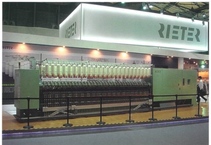
Abb. 1: Ringspinnmaschine G 32 von Rieter

Der Besuch der offiziellen chinesischen Delegation unter der Führung von Minister Du, der Besuch des Verwaltungsrates der Rieter Holding und des Schweizer Botschafters in China, Blaise Godet, freute Rieter ausserordentlich (Abb. 2). Rieter wendet hohe Beiträge für die Forschung und Entwicklung auf. Dies ermöglicht es, innovative Produkte herzustellen und diese den Bedürfnissen der Märkte anzupassen. Dieses Engagement gilt für China und auch für den Standort Schweiz, dessen Werte Rieter global vertritt. Sie spiegeln sich wider in