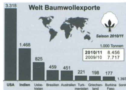
Abb. 2: Welt-Baumwollexporte

Auch für die Importe wird 2010/2011 mit einer fortgesetzten Erholung gerechnet und ein Zuwachs um 9% auf 8,5 Millionen Tonnen erwartet. Dieser Anstieg wird mit 3,1 Millionen Tonnen durch die chinesischen Importe angetrieben (+29%). Die chinesischen Bestände nahmen 2009/10 erheblich ab, sodass die chinesische Regierung im August damit begann, eine grössere Menge ihrer nationalen Reserven auf den Markt zu bringen. Die Einfuhren der Türkei werden 2010/11 dank einer grösseren Ernte voraussichtlich auf 786'000 Tonnen sinken. Die US-Exporte 2010/2011 werden infolge einer erwarteten grösseren Ernte auf 3,3 Millionen Tonnen (+27%) prognostiziert, sodass der Anteil der USA am globalen Export von 34 auf 39% ansteigen könnte. Auch für die Exporte Indiens, Brasiliens und Australiens wird mit einem Zuwachs gerechnet (Abb. 2).