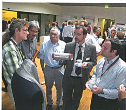
Abb. 6: Netzwerk Corners