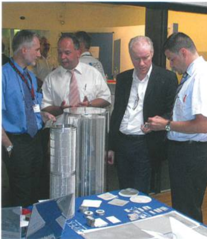
Abb. 7: Netzwerk Corners

am Kragen auf (Abb. 4), sobald der Arm gehoben wird, als ob man Samen sät. Mit einer Handbewegung werden projizierte Schmetterlinge aufgescheucht.