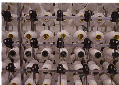
Abb. 2. Reduzierter Ballonbegrenzer der bisherigen Lösung für die Fadenspanner Elemente

Damit hierbei die Komponenten zur Fadenspannungsregelung nicht im Wege sind, wurden die Ballonbegrenzer in ihrer ursprünglichen Kreisform reduziert (Abb. 2) – ein Kompromiss zwischen den Anforderungen an den Bauraum