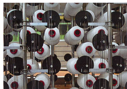
Abb. 3. Grosszügig bemessener Raum für den Materialwechsel an jeweils sechs Spulenplätzen des neuen Gatters

Mehr Sicherheit bei der Fadenführung bietet nun ein neues Gatterdesign. Die optimierte Gestaltung bietet Platz für 20 Spulen horizontal und 18 Spulen vertikal, also für insgesamt 360 Spulen – bei nahezu gleicher Höhe wie die ursprüngliche Version. Für die Umsetzung der Bauraumkompression wurde das Gatter auf die im Spitzenmarkt üblichen Spulenformate mit einem Durchmesser von 135 mm und einer Länge von 250 mm ausgelegt. Zudem erhalten die gewickelten Garnspeicher in einer reihenweise versetzten Anordnung ihren Platz. Jede zweite Position je Reihe wird dabei nicht besetzt. Es entsteht ein spezifisches Belegungsmuster mit jeweils sechs Spulen um einen kreisförmigen, grosszügig bemessenen Entnahmeraum (Abb. 3).