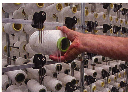
Abb. 1. Spulenwechsel am herkömmlichen Querabzugsgatter

Die ursprüngliche Version des Equipments für die Fadenlieferung zur Maschine nimmt in 12 Etagen und 24 Reihen maximal 288 Spulen auf. Die Anordnung der Spulen gestattet eine kompakte Bauform und bietet gerade soviel Platz, dass die Spulen gewechselt werden können (Abb. 1).