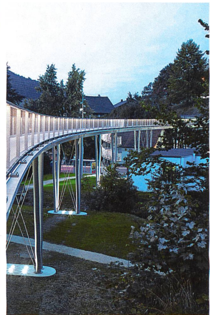
Abb. 1: Die längste Textilbetonbrücke der Welt

Am 05. November 2010 übergab Groz-Beckert die Textilbetonbrücke, die im September für den Schuljahresbeginn bereits freigegeben wurde, offiziell an die Stadt Albstadt (Abb. 1).