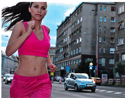
Abb. 3: Kompressions- und Multifunktionsstoffe

Synthetiks mit creora® performance H-350 liefern starke Kompressionsfunktionen dort, wo sie gebraucht werden. Schnell trocknende, Feuchtigkeit regulierende und leichte Funktionsstoffe mit aerocool® Polyester oder das neue Mipan® aqua X helfen dem Träger, neue Ziele zu erreichen. Stoffe und Kleidungsstücke bekommen durch aerocool® prizma «cat-dye» Polyester ein 80er-Jahre Feeling mit einer auffälligen Optik in kräftigen Tönen. askin® Polyester bietet darüber hinaus Schutz vor UV-Strahlung (Abb. 3).