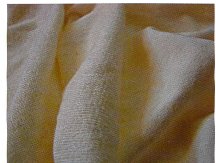
Abb. 2: Hyosung Vlies, 98 % Baumwolle / 4 % creora®

Der Schwerpunkt liegt in diesem Bereich auf leichten Stoffen mit technischen Eigenschaften, die die nötige Funktion bieten, sich aber dennoch für Street- und Casualwear eignen (Abb. 2).