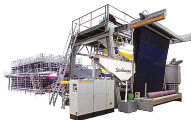
Abb. 7: Die Webmaschine D_LOOP

Die ALPHA 400 Teppichwebmaschinen-Reihe wurde vor vier Jahren auf der ITMA 2007 erstmals der Öffentlichkeit vorgestellt. Mittlerweile hat die Maschine ihre Eigenschaften erfolgreich bewiesen und produziert bei vielen Kunden Teppiche, Läufer und Auslegeware für den Heimtextil-, Objekt- und Transportbereich. Die ALPHA 400, die in fünf Konfigurationen zur Verfügung steht, produziert Teppiche in ausgezeichneter Qualität und mit beeindruckenden Dessins bei ausserordentlich hohen Produktionsgeschwindigkeiten.