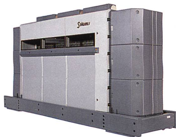
Abb. 2: UNIVAL 100 mit Einzelfadensteuerung

Vor mehr als zehn Jahren führte Stäubli mit der UNIVAL 100 einen Jacquardmaschinenantrieb ein, der ohne mechanische Verbindung zur Webmaschine arbeitet. Seitdem hat das Unternehmen diese Lösung weiter verfeinert und an die komplette Jacquardmaschinenreihe angepasst. Alle Jacquardmaschinen werden nun unabhängig von der Webmaschine – also ohne Kardanwelle oder Riemen – angetrieben. Dieses Prinzip bietet wesentliche Vorteile. Dazu zählen die Reduzierung der bewegten Teile und die einfachere Anpassung an die verschiedenen Webmaschinenentypen.