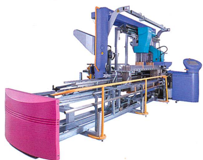
Abb. 5: Die automatische Einziehmaschine SAFIR S80

Rechtzeitig vor der ITMA 2011 kann Stäubli die neu entwickelte Rotations-schaftmaschinen-Familie S3060/S3260 ankündigen (Abb. 4). Auf der Basis des vor Jahrzehnten von Stäubli erfundenen Rotationsprinzips für Schaftmaschinen, hat die neue Schaftmaschine ein neuartiges Haltesystem – das Herz jeder Schaftmaschine. Das neue System verbessert die Sicherheit für die Auswahl der Webschäfte und erlaubt höhere Laufgeschwindigkeiten bei verbesserter Zuverlässigkeit. Dank der neuartigen Technologie ist die Maschine nun kompakter, generiert, trotz der höheren Geschwindigkeit, weniger Lärm und Schwingungen. Die Schaftmaschine hat ein integriertes Kühlsystem und erfordert nur geringen Wartungsaufwand.