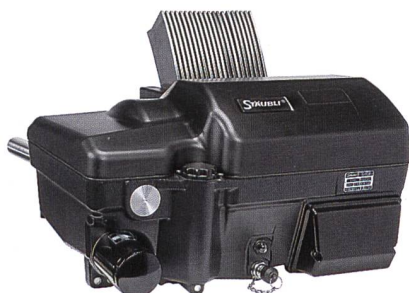
Abb. 4: Die elektronisch gesteuerte Rotations-schaftmaschine S3000

Sowohl die UNIVALETTE als auch die CX 182 werden auf dem Messestand gezeigt.