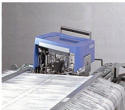
Abb. 6: Die Anknüpfmaschine für mittlere und grobe Garntypen MAGMA T12

nenreihe umfasst nun auch die neuen Typen 1671/1681/1781. Mit dem leistungsfähigen Exzenter-Hebel-System und der breiten Palette an symmetrischen und unsymmetrischen Kurvenscheiben bieten diese Maschinen eine hohe Flexibilität.