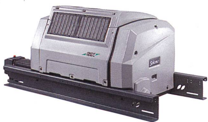
Abb. 1: Die neue elektronisch gesteuerte Jacquardmaschine SX V

Seit ihrer Einführung vor einem Jahr hat die Jacquardmaschine, Typ SX, breite Akzeptanz bei den Kunden gefunden. Die universelle Maschine ist für eine grosse Einsatzbreite konzipiert und erfüllt somit die höchsten Ansprüche. Die SX ist kompakt und bietet eine höhere Leistung im Vergleich zu anderen Jacquardmaschinen – das heisst, höhere Belastungen und höhere Geschwindigkeiten sind möglich. Der nahezu vibrationsfreie Antrieb ist ausserordentlich zuverlässig und energieeffizient. Die Maschine benötigt weniger Ersatzteile und erfordert nur einen geringen Wartungsaufwand. Die SX ist mit 1'408 und 2'688 Platinen verfügbar. Sie kann mit Greifer-, Luftdüsen- und Projektilwebmaschinen kombiniert werden. Gegenwärtig arbeiten über 100 SX-Maschinen in Webereien weltweit mit den unterschiedlichsten textilen Anwendungen. Auf dem