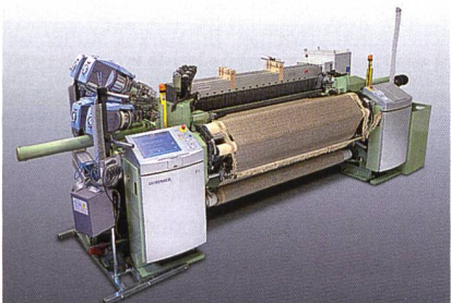
Abb. 4: DOB-Gewebe auf einer Greiferwebmaschine Typ PTS8/S 20 C in 190 cm MNB

Das Herz der Greiferwebmaschine ist der bewährte DORNIER Schusseintrag mit positiv gesteuerter Mittenübergabe. Zuverlässig und präzise wird der Schussfaden aufgenommen, übergeben und bis zur Abbindung im Offenfach sicher gehalten. Durch den Einsatz der hochdynamischen Streichbaumeinrichtung (DWG) wird auch bei hochschäftigen, komplexen Artikeln ein optimaler Spannungsausgleich der Fäden ermöglicht. Der flexible Eintrag von sehr dünnen bis zu größten Schussgarnen pic-à-pic wird anhand eines Bekleidungsstoffes der Alta Moda gezeigt (Abb. 4).