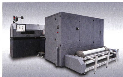
Abb. 1: Kappa 180 - Gesamtansicht