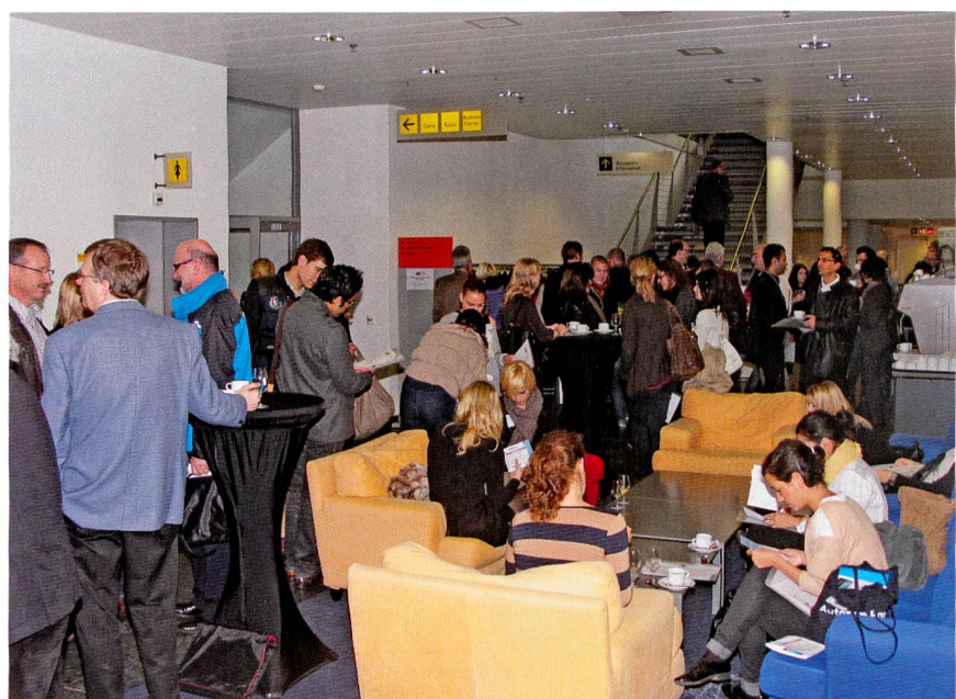
Angeregte Diskussionen während den Kaffeepausen

Der Leitfaden «Nano Textiles» soll Unternehmen der Textil- und Bekleidungsindustrie den sicheren Zu- und Umgang mit Nanotechnik erleichtern. Denn nur wer zuverlässig sichere und innovative Produkte herstellt, hat im Wettbewerb die Nase vorn. Der TVS Textilverband Schweiz will beim Thema Zukunftstechnik und Risiken nichts verschlafen, deshalb beschäftigt man sich bereits seit 2007 damit, welche Chancen und Risiken die Nanotechnologien für Textilunterneh-