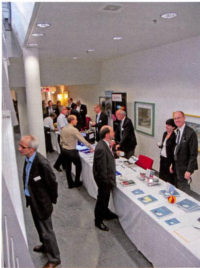
Diskussionen an den Ausstellertischen

zu applizieren, wobei höhere Temperaturen den Badauszug verbessern. PROTELAN LGS plus ermöglicht die Fertigung brillanterer Pastelltöne und die Erzielung eines maximalen Weissgrades bei optisch aufgehellten Qualitäten. PROTELAN NOX verhindert die durch Stickoxideinwirkung verursachte Vergilbung und reduziert die Farbempfindlichkeit elastischer Artikel gegenüber Luftverschmutzung, insbesondere Verbrennungsgasen, sowie gegenüber der Behandlung in gasbeheizten Spannräumen.