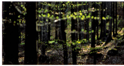
Abb. 4: Buchenwald – die Rohstoffquelle