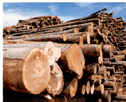
Abb. 2: Die Lenzing AG produziert seit über 70 Jahren Regeneratfasern aus dem nachwachsenden Rohstoff Holz

Die gesamte Produktpalette der Lenzing Gruppe entspricht den Anforderungen des OEKO-TEX® Standards 100 nach gesundheitlicher Unbedenk-