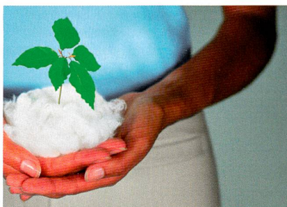
Abb. 1: Der Erfolg von Lenzing basiert auf einer konsequenten Kundenorientierung gepaart mit Innovations-, Technologie- und Qualitätsvorsprung