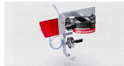
Abb. 2: USTER® CLASSIMAT 5 Messkopf am Befestigungsmodul

Neben der gesamten Palette an Qualitätsmessdaten, die der USTER® CLASSIMAT 5 bestimmen kann, steht nun ein zusätzliches Analysewerkzeug zur