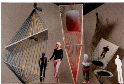
Abb. 1: Ruckstuhl by atelier oï