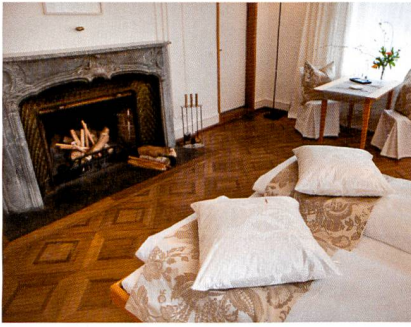
Abb. 2: Das neue textile «Märchenzimmer» im Schloss Wartegg in Rorschacherberg

Dekorstoffe von Christian Fischbacher Co AG, auf: «Der Positionierung des Schloss-Hotels entsprechend, liegt das Schwergewicht in der Gestaltung auf dezenter Festlichkeit, Pflanzen-Ornamenten und der lebendigen Struktur von Leinen und edlem Baumwoll-/Seidenstoff.»