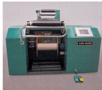
Abb. 3: Rechnergestützte Direktschärmaschine von KARL MAYER

zeugen. Seit dem vergangenen Jahr konnte KARL MAYER vier neue türkische Kunden im Bereich gewirkter Heimtextilien gewinnen. Die Unternehmen sind mit einer Basisausstattung in das Wirkwarengeschäft eingestiegen und werden, setzt sich der Trend bei der Nachfrage fort, ihre Kapazitäten in den kommenden Monaten weiter ausbauen. Die ersten Rau- und Scherversuche liefern im Frühjahr erfolgreich. Bezüglich der technologischen Umsetzung dominiert derzeit die Rauvelours-Fertigung.