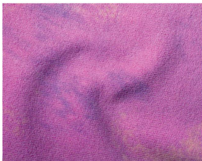
Abb. 2: Wirkvelours von der HKS 3-M

Die Wareneigenschaften zeigen insgesamt je nach dem eingesetzten Verfahren feine Unterschiede und haben damit einen Einfluss auf die Entscheidung über die jeweils geeignete Technologie. Ein weiterer Faktor hierbei ist die vorhandene Ausstattung des Maschinenparks. Verfügt ein Hersteller beispielsweise bereits über das Equipment zum Scheren, bietet sich die Fertigung der Polschlingenvariante oder des elastischen Velours an.