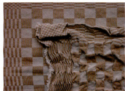
Abb. 2: Nach dem Waschen: die Vorteile der «Beau Fixe» Technik (Gewebe im Hintergrund) sind offensichtlich

Seit vielen Jahren arbeitet Veramtex konsequent daran, dem Leitbild einer sauberen Umwelt und – vor dem Hintergrund möglicher Gesundheitsbeeinträchtigungen der Mitarbeiter durch Ammoniak (z. B. Schleimhaut- und Augenreizungen) – auch optimaler Arbeitsbedingungen zu entsprechen. Dies belegt nicht zuletzt die bereits im Jahr 2000 erfolgreich durchgeführte und seither regelmässig erfolgreich erneuerte Zertifizierung als umweltfreundliche und sozialverträgliche Betriebsstätte gemäss OEKO-TEX® Stan-