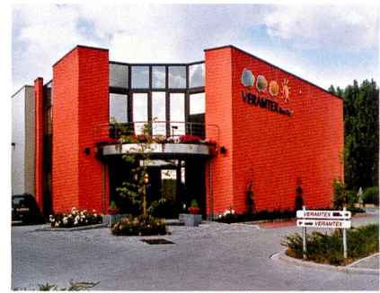
Abb. 1: Das belgische Unternehmen hat sich auf die Behandlung von Textilien aus Naturfasern spezialisiert

Kernpunkt der «Beau Fixe» Technologie ist die Verwendung von flüssigem Ammoniak, die grundsätzlich bei jeder Faser pflanzlichen Ursprungs wie zum Beispiel Baumwolle, Leinen oder Lyocell angewendet werden kann. Ammoniak ist eine chemische Verbindung von Stickstoff und