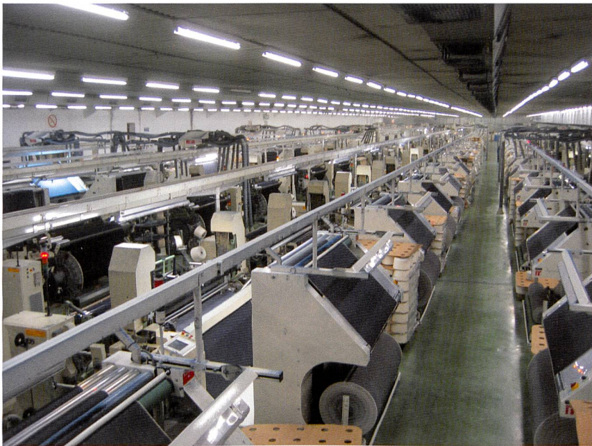
Abb. 6: die Weberei des Unternehmens

Im Bereich Arbeitsbekleidung und Technischen Textilien liegt der Fokus des Unternehmens auf hocheffizienten textilen Lösungen, die Sicherheitsaspekte, Funktionalität und Komfort vereinen. Unter der Markenbezeichnung Techs® beliefert Textil Santanderina, S.A. führende europäische Hersteller von Arbeitsbekleidung, Schutztextilien und Bekleidung für den Gesundheitssektor sowie von Textilien für das Militär.