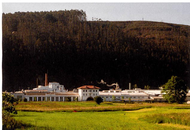
Abb. 4: Textil Santanderina, S.A. – ein vollstufiger Textilbetrieb

Bereits 1998 liess das Unternehmen erste Artikel des Sortiments gemäss den Vorgaben des OEKO-TEX® Standards 100 zertifizieren. Mittlerweile erfüllen sämtliche Kollektionen und Produkte die strengen humanökologischen Anforderungen des OEKO-TEX® Standards 100. Das breite Sortiment von Textil Santanderina, S.A. umfasst dabei zu einem grossen Teil Stoff- und Denimkollektionen für den Bekleidungsbereich. Dafür werden hauptsächlich Baumwoll- und Baumwollmischgarne verarbeitet. Spezielle Materialkompositionen mit Lycra® und Tencel® sorgen für maximalen Komfort und exklusive Bequemlichkeit. Zum Angebot des Unternehmens gehören auch qualitativ hochwertige Leinen- und Leinenmischgewebe sowie innovative Materialmischungen. Die neueste Entwicklung im Bekleidungsbereich ist Lancel®, eine Kombination aus exklusiver Wolle, dem samtigen Griff von Tencel® sowie dem Stretch-Komfort von Lycra® für den Einsatz in anspruchsvollen Bekleidungssegmenten. Spezielle Ausrüstungsverfahren bedienen sämtliche Anforderungen an topaktuelle Modetrends wie z.B. trendige Fading-Effekte im Denim-Bereich, höchste Funktionalität wie z.B. Bügelfreiheit oder zusätzliche Eigenschaften wie etwa eine wasser- oder schmutzabweisende Wirkung.