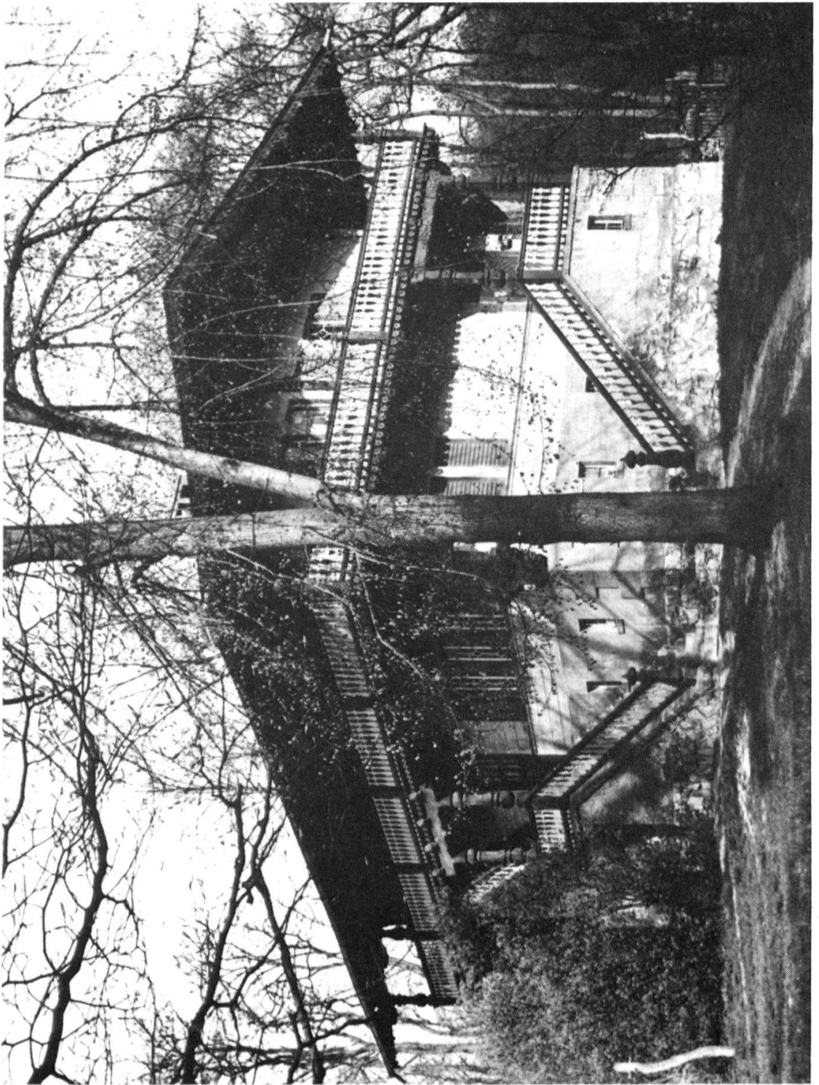
Schweizerhaus 1941, nach 1961 abgerissen.