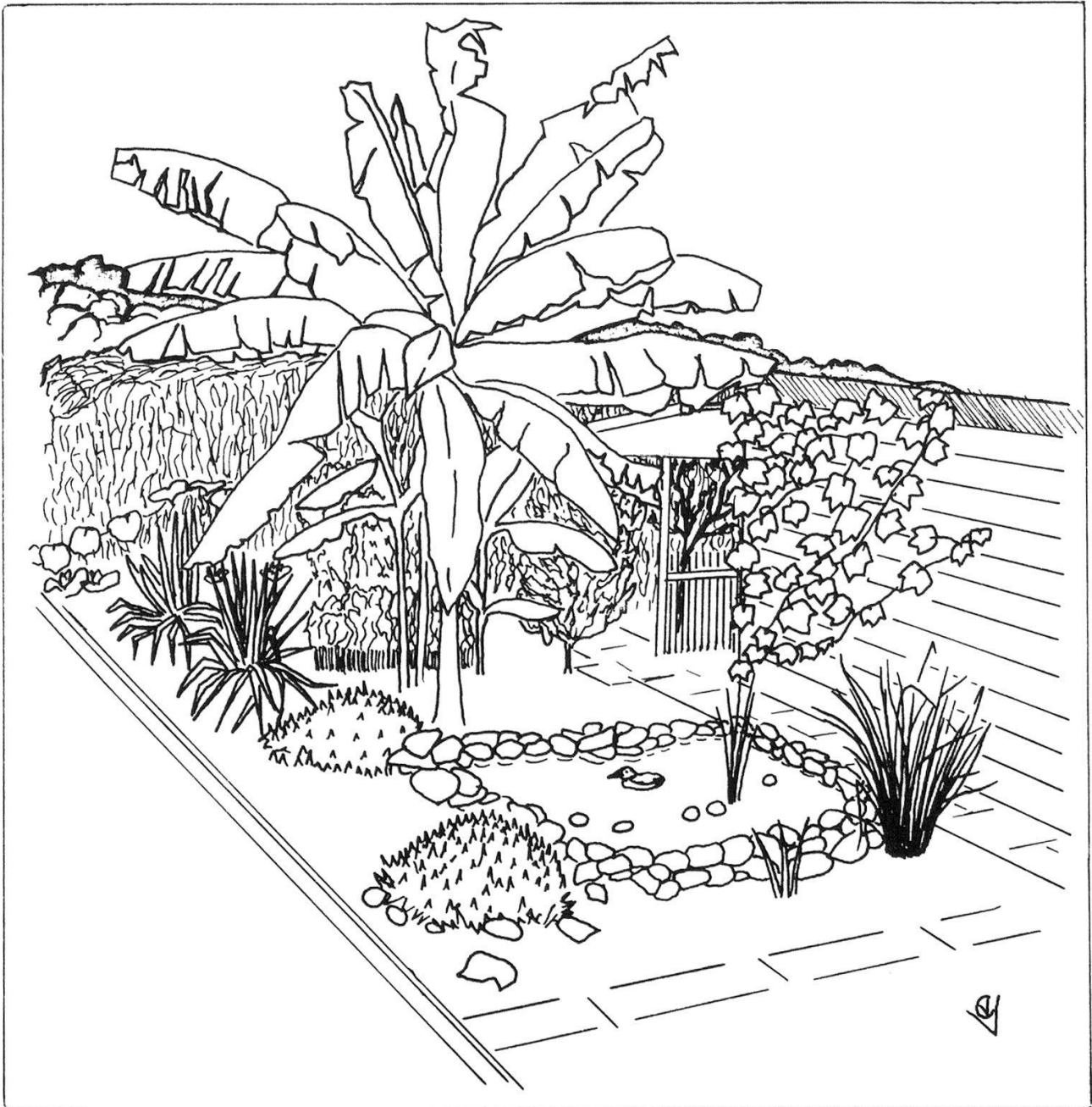
Moderner, freizeitbetonter Familiengarten mit exotischer Bepflanzung und Teich.

Fast alle Gärten der Anlage «Spittelmatt» weisen auf ihrer Breitseite ein etwa gleich tiefes Zierbeet auf, das über die ganze Breite des Gar-