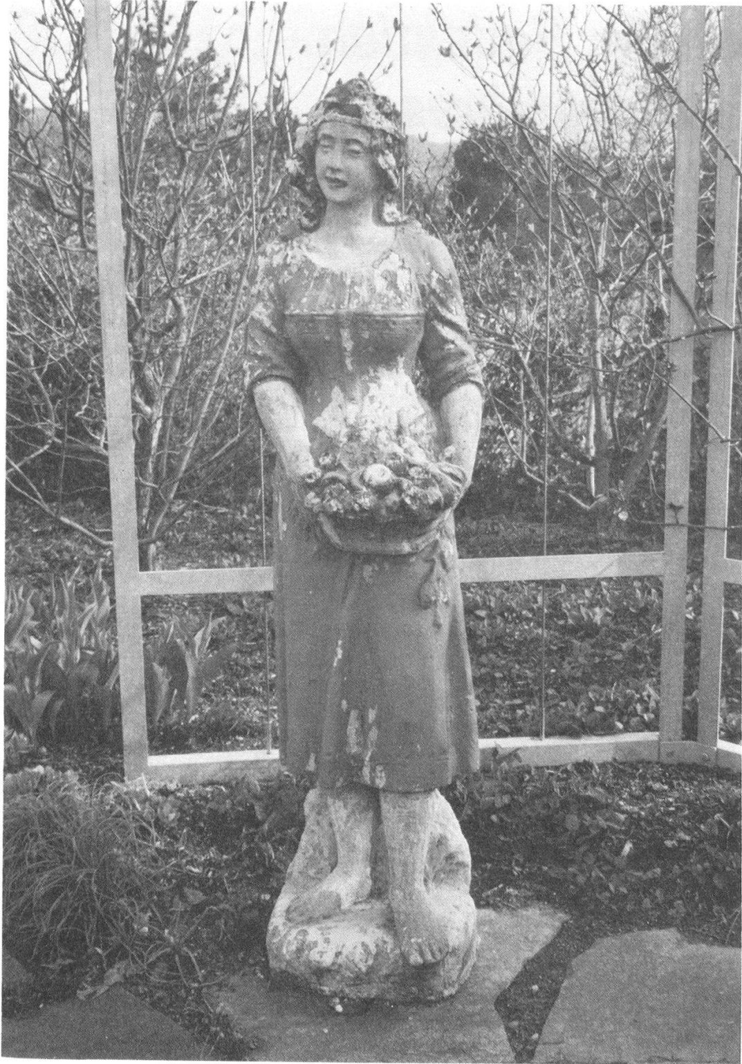
Unbekannte Schöne in einem Garten am Zürichsee