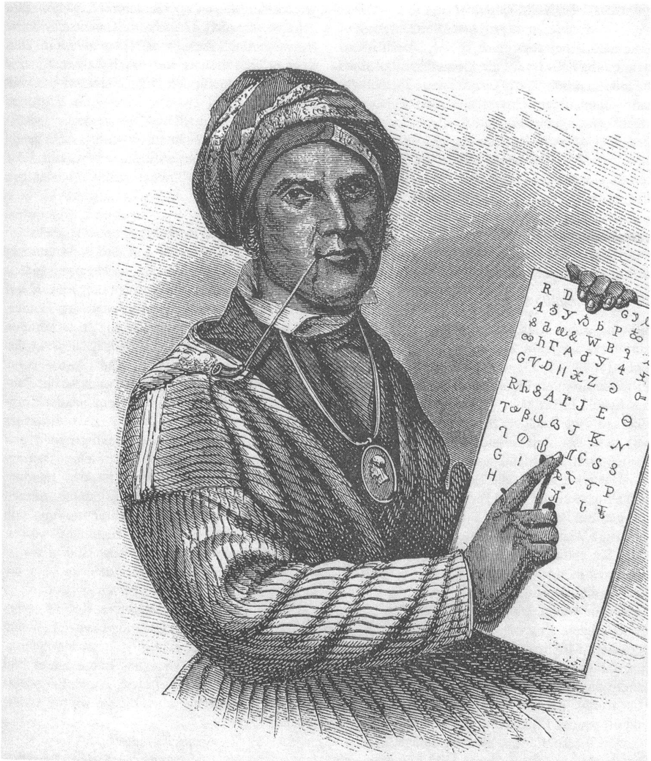
Der Indianer Se-Quo-Yah in einem Stich von 1870. Nach ihm leitete der damalige Direktor des Botanischen Gartens in Wien L. Endlicher den Gattungsnamen «Sequoia» ab.