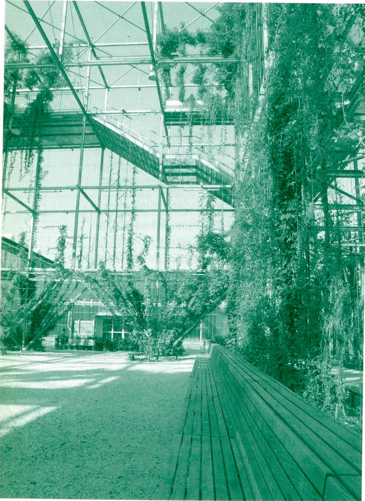
Blick von der langen Holzbank auf die raumhaltige Fassadenschicht mit Treppen und Gehsteigen.

lich und gestalterisch auf die Tradition des Ortes – während mehr als hundert Jahren wurde auf dem damals eingezäunten Areal in grossen Industriehallen schweres Material zu Lokomotiven und Flugzeugmotoren verarbeitet – zu verweisen. Statt einen über Jahrhunderte bekannten Park- oder Gartentypus in eine zugeordnete Fläche hineinzuprojizieren, haben sie versucht, auf den Kontext durch gestalterische und ideologische Mittel zu reagieren. Zweifellos am besten gelungen ist in dieser Hinsicht der MFO-Park 6 , eine von grünen Rankhilfen überzogene Stahlkonstruktion in den Dimensionen der Industriehalle, die vorher während rund 100 Jahren an diesem Ort stand.