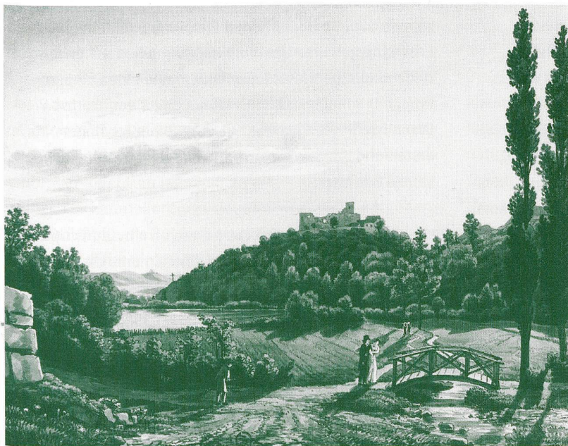
Abb. 3: Ermitage Arlesheim, Landschaft mit Schloss Birseck Zeichnung von S. Birmann, 1814

det den absoluten Mittelpunkt von Schloss, Garten und Stadt. Auf diesen Punkt laufen alle Achsen zu. Denn für den französischen Garten war die Architektur massgebend, sie stand in der Hierarchie der Künste am höchsten. Nach ihr und ihren Gesetzen hatte sich die Parkanlage zu richten. Schnurgerade Wege, Wasserbecken in geometrischen Formen und zu perfekten Zylindern und Würfeln zurechtgestutzte Büsche sind die Merkmale des französischen Gartens. [...] Der neue Gartentypus wurde in England entwickelt. Deshalb sprach man in der Folge auch vom englischen Garten. Zunächst wurde die Zentralachse des symmetrischen Gartens aufgegeben, ebenso wie die vollständige Überschaubarkeit der Anlage vom Balkon des Herrschaftshauses oder Schlosses aus. Die Gartenarchitekten orientierten sich nicht länger an der Architektur, sondern an der Malerei und – an der freien Natur. [...] Die wichtigsten Komponenten eines Parks in englischer Manier sind lockere Baumgruppen, Blumenwiesen, Fluss- und Bachläufe, gewundene Wege und überraschende Ausblicke auf Pavillons, Tempelchen und andere dekorative Bauwerke.» 10 Die Ermitage in Arlesheim, die 1785, also drei Jahre nach der Publikation der Jardins , eröffnet wurde, ist ein perfektes Beispiel eines englischen Gartens (Abb. 3). William Kent, der Pionier der englischen Gartenkunst, entwirft als erster Gartenszenen nach den Regeln der Land-