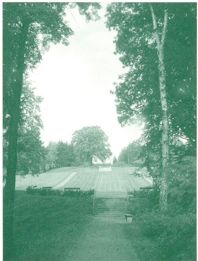
Blick vom Kidrontal auf Jüngerwiese und Ölberg mit «Ölbaum» und Krematorium; Fotografie von Marius Winzeler 2006

weislich mehrere Exemplare davon, sodass seine Kenntnis bereits zur Bauzeit um 1500 vorausgesetzt werden kann. Doch war es wohl nicht zuletzt die Sage von Emmerichs eigenen Reisebegleitern, die dazu geführt hat, dass die Görlitzer Grabkapelle schon früh als besonders genaues Abbild des Originals in Jerusalem galt, was zu einer überaus hohen Wertschätzung führte. Eindrücklich offenbart sich diese vor allem in dem Umstand, dass für vier weitere Nachbauten des Heiligen Grabes der Görlitzer Bau als Vorbild diente: in den schlesischen Orten Sagan (Żagań) und Neuland (Niwnice) bei Löwenberg (Lwówek Śląski), in der Warschauer Vorstadt Nowy Świat bei Ujazdów sowie im böhmischen Reichenberg (Liberec).