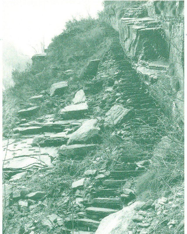
Fotografia di Giuseppe Martini tratta da Federico Balli, Valle Bavona , a cura di Giuseppe Martini, Locarno: Armando Dadò editore, 1996