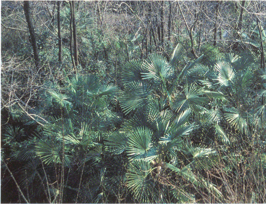
Abb. 5: «Exoten» erobern siedlungsnaher Wälder. Palmenpopulation bei Madonna dal Sasso/ Locarno, um 2002.