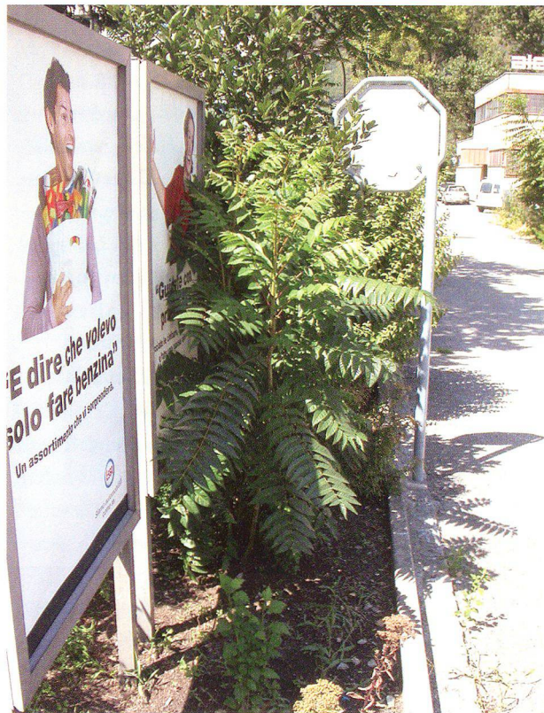
Abb. 2: Der Götterbaum als Brachenbesiedler, 2004.

Nur wenigen Neobiota gelingt die Unterwanderung naturnaher und der Aufbau neuartiger Pflanzengesellschaften. 18 Die meisten etablieren sich in ökologischen Nischen, die von der einheimischen Flora unbesetzt bleiben, und können so innerhalb der Ökosysteme auch wichtige Ersatzfunktionen wahrnehmen. 19 Untersuchun-