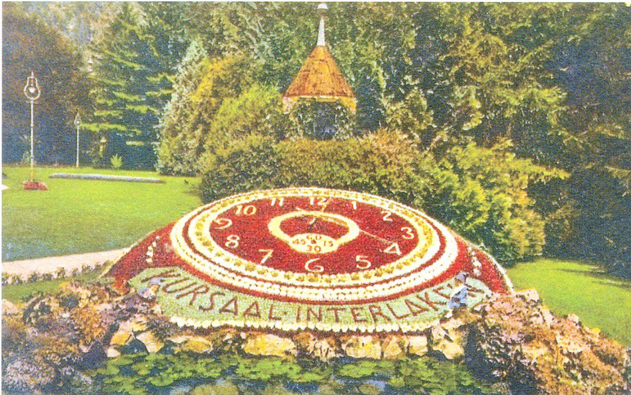
Abb. 9: Blumenuhr, Interlaken, Postkarte.

Nicht nur Sonne und Mond sind Orientierungspunkte der Zeitmessung, sondern auch Blühverhalten von Blumen im Tagesablauf. Bei richtigem Standort und Wetter öffnen oder schliessen sie ihre Blüten immer zur gleichen Zeit. Gut kennt man diese «Öffnungszeiten» bei den Seerosen, die sich morgens um 7 Uhr entfalten und um 3 Uhr nachmittags wieder schliessen. Andere Blumen wie die Mittagsblume drücken diesen Sachverhalt mit ihrem Namen aus. Auch die Ringelblume schliesst ihre Blüte bereits am Mittag, während die Tigerlilie sich dann erst öffnet. Zu den nachtaktiven Blühern gehört die Nachtkerze. So sichern die gestaffelten Blühzeiten den tierischen Bestäubern – Bienen, Insekten, Käfer, Falter – während 24 Stunden einen «gedeckten Tisch».