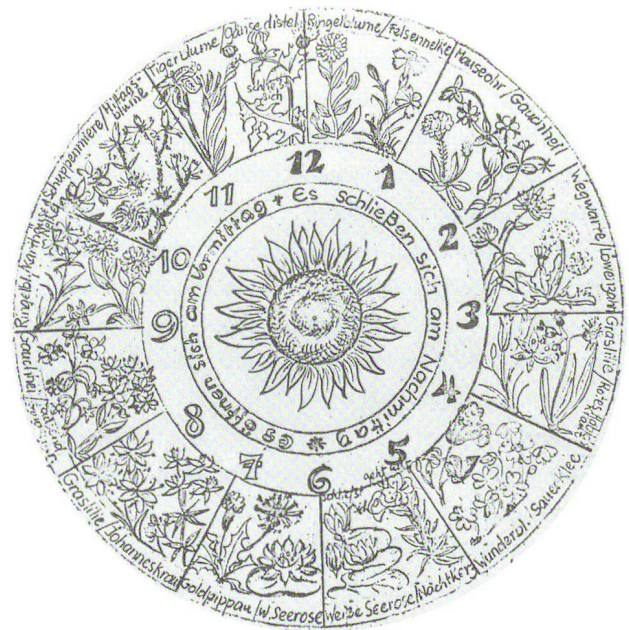
Abb. 8: Blumenuhr nach Carl von Linné, 1745.

Die ursprüngliche Blumenuhr, von der wir erstmals im 18. Jahrhundert hören, hat indessen einen chronobiologischen Hintergrund und geht auf die Tätigkeit des schwedischen Naturforschers Carl von Linné zurück.