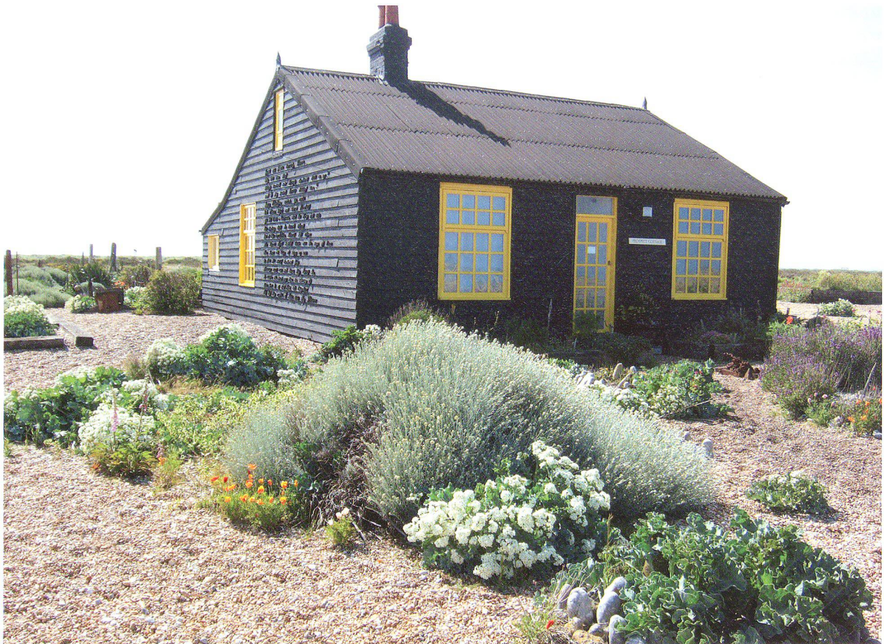
Abb. 4: Derek Jarman, Garten in Dungeness, Kent.

und schuf daraus Skulpturen, Erinnerungsmale, die er in dem ungeordneten, von keinem Zaun umgebenen Gelände platzierte. Allmählich wuchs daraus ein Gesamtkunstwerk, das gärtnerische Prozesse sichtbar macht und das auch zum Sinnbild für Jarmans Kampf gegen Aids geworden ist.