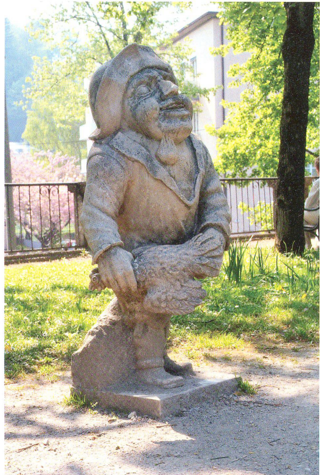
Abb. 6: Zwerg mit dem Huhn, Zwerggarten in Salzburg.

Im Garten ist die Grenze zwischen Kitsch und Kunst, zwischen low und high, nicht einfach zu ziehen. Was eigentlich künstlerischen oder wissenschaftlichen Ursprungs