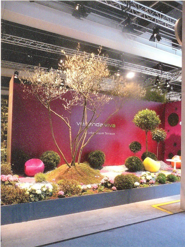
Abb. 5: Giardina Zürich, 2012.

schaftsordnung, wie sie der Soziologe Pierre Bourdieu beschrieben hat. Haus und Garten werden in der heutigen Zeit aus ganz unterschiedlichen Motiven heraus geplant, gebaut und bewohnt. Häufig geht es darum, einen Lebensstil zu realisieren und zu zeigen. Unter diesen Bedingungen sind ganz besonders Gärten Ausdruck von Geschmack und Mode. Als distinktive Zeichen drücken sie weniger eine individuelle Botschaft oder ein Können aus, vielmehr zeigen sie an, in welchen kulturellen und sozialen Kontexten der Urheber und Besitzer des Gartens verankert ist.