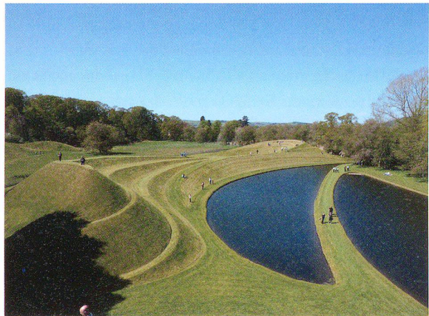
Abb. 3: Charles Jencks, Garden of Cosmic Speculation, Dumfries, Schottland.

Im Süden Englands, in Dungeness, entstand ein ganz anderes Gartengebilde. Der Filmregisseur Derek Jarman kaufte 1986 ein kleines Cottage, eine ehemalige Fischerhütte, in der Nähe des Strandes, und begann dort auf kargem Boden mit grossen Mühen einen kleinen Garten anzulegen. Prospect Garden ist Ausdruck einer intensiven Auseinandersetzung mit einer unwirtlichen Natur. In dem rauen Klima experimentierte er mit wild wachsenden Kräutern und Blumen und sammelte zusammen mit Freunden Steine, angeschwemmtes Holz, alte Gartengeräte