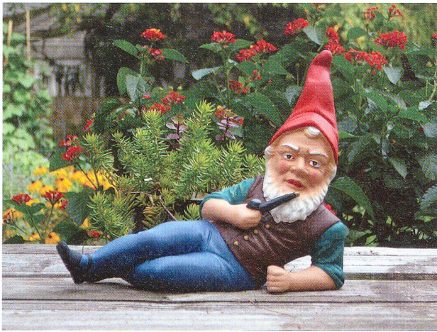
Abb. 7: Liegender Gartenzwerg.

in den Haus- und Schrebergärten so grossen Absatz fanden, dass bereits 1872 Gartenzwerg in Serienproduktion hergestellt und ab 1898 auf die Leipziger Messe gebracht wurden. Nicht nur kostbare Pflanzen wanderten aus fürstlichen Anlagen in Pfarr-, Bauern- und Handwerkergärten, sondern auch der Gartenzwerg, wenn auch nicht als Steinskulptur, sondern in bescheidenerer Ausführung. Deshalb wird er aus der Perspektive der elitären Kunst gerne als «Statue des kleinen Mannes» bezeichnet.