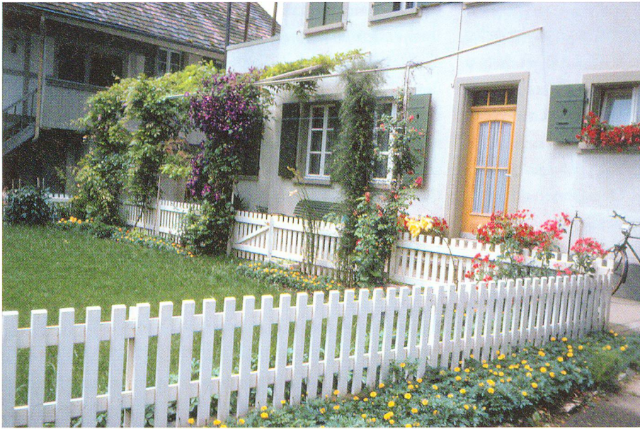
Abb. 3: Innovativer Seeländer Bauerngarten.

Seite von Bern jährlich das ganze Gebiet des Grossen Mooses. Die ländliche Bevölkerung drängte sich in engen und bescheidenen Reihendörfern auf den Kuppen der kleinen Hügelzüge, die sich aus dem Moos erhoben und kämpfte ums Überleben. Unter diesen Rahmenbedingungen entwickelte sich in dieser Region, die übrigens nicht weiter von Bern entfernt ist als das Emmental, wenig Selbstbewusstsein und schon gar kein Wohlstand. Nach der ersten Juragewässerkorrektion (1868–1891) eröffnete sich den Seeländer Bauern jedoch auf einmal ein immenses Ackerbaugelände, allerdings mit nur leichten, trockenen und mageren Böden, denn der kiesige Untergrund und die geringe jährliche Niederschlagsmenge ermöglichte keine tiefgründige Bodenbildung. Die wenig traditionsbewussten Bauern erwiesen sich in dieser Situation als innovativ, hängten die herkömmliche Landwirtschaft an den Nagel und verlegten sich auf den Erfolg versprechenderen Anbau von Gemüse. Fortan fuhren sie frühmorgens wie Fabrikarbeiter von zuhause weg hinaus aufs Moos und kehrten erst am Abend von dort wieder zurück. Wen wundert's, dass sie die kleinen, zwischen Haus und Strasse eingepferchten ehemaligen Gartenflecken nicht weiterhin mit Salat und Gemüse bepflanzen? Vielmehr mussten die Gärtchen entweder einem dringenderen Nutzen weichen oder wurden