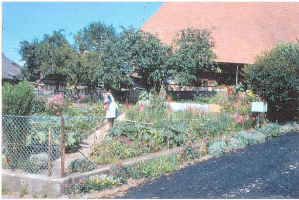
Abb. 4: Bäuerin in ihrem Reich.