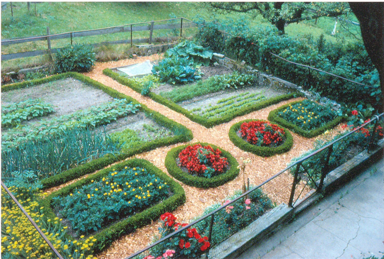
Abb. 2: Traditionsbewusster Bauerngarten im Emmental.

Während der Jahrhunderte, in welchen im Emmental Selbstbewusstsein, Traditionen und Wohlstand entstanden, verwüstete die Aare im Seeland auf der anderen