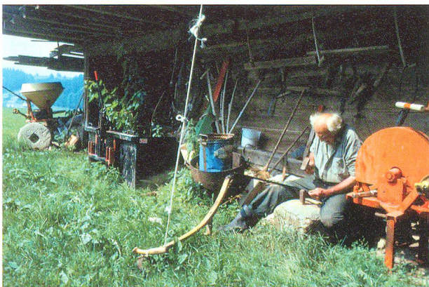
Abb. 5: Traditionelle Wirtschaft als Grundlage der Erhaltung ästhetischer Werte.

liches Pflanzensortiment auf. Die Gestaltung und die Bepflanzung der Bauerngärten hängen nach wie vor ganz wesentlich mit der regionalen Geschichte und der sozio-ökonomischen Situation einer Region zusammen. Dieser Zusammenhang wird in der umfassendsten und wichtigsten Publikation zum Thema, Bauerngärten der Schweiz von Albert Hauser, erschienen 1976 im Zürcher Artemis Verlag, sorgfältig beschrieben. Er macht verständlich, warum sich die «unbeeinflussten» Bauerngärten, selbst in einem begrenzten geografischen Gebiet wie der Schweiz, von Region zu Region deutlich in ihrem Aspekt unterscheiden. Für diese Unterschiede gibt es, wie die beiden erwähnten Beispiele aus dem Emmental und dem Seeland gezeigt haben, gute Gründe, die für das Verständnis und die